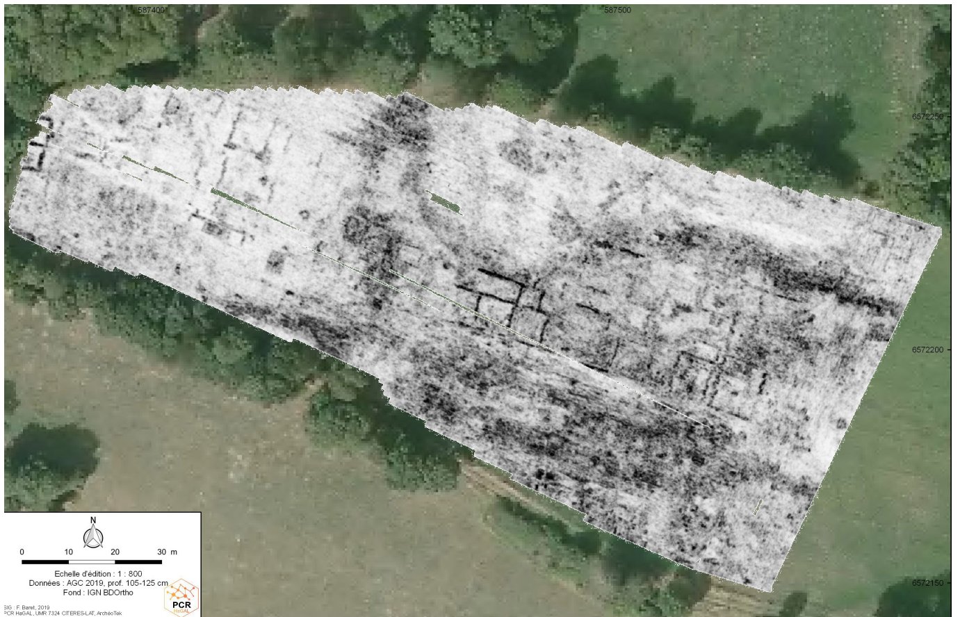
La Souterraine - Campagne de cartographie géoradar de l'agglomération antique de Bridiers Exemple de carte géoradar (profondeur cumulée : 105-125 cm).