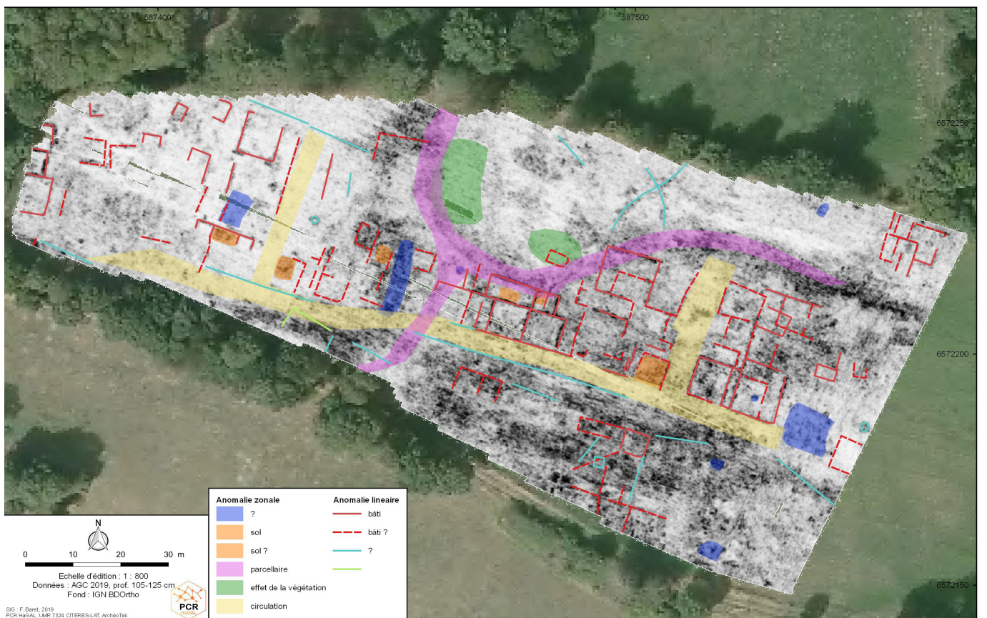
La Souterraine - Campagne de cartographie géoradar de l'agglomération antique de Bridiers Cartographie générale des résultats.