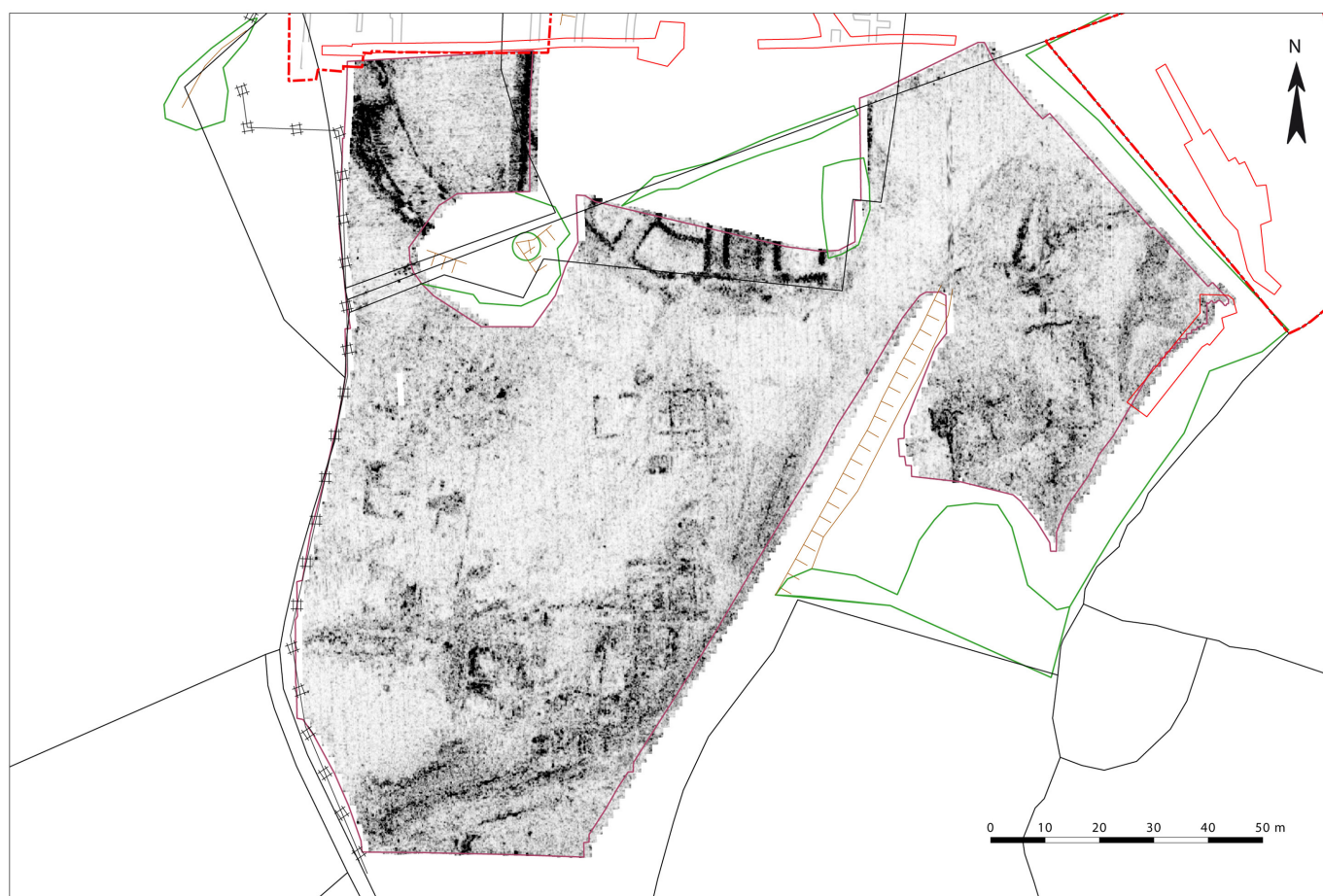
Habitat Groupé Antique de la cité des Lémovices - Naves Résultats du géoradar

On insistera sur le fait qu'aucune trace n'a été retrouvée du bâtiment à colonnes interprété comme un temple par J.-F. Bonnafox situé à La Planèze et placé sur cette parcelle (23.001.014). L'emplacement indiqué « sur la droite du chemin qui conduit d'Ahun au Moutier » pourrait correspondre à notre intervention,