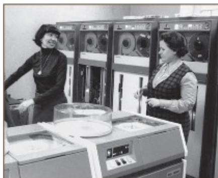
Fig. 3. Ordinateur soviétique ES-1030 au service du recensement, à Moscou (1979).