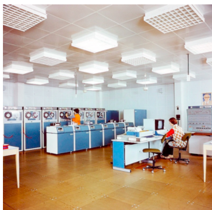
Fig. 4. Ordinateur moyen soviétique ES-1035 dans un centre de traitement en URSS (vers 1983).