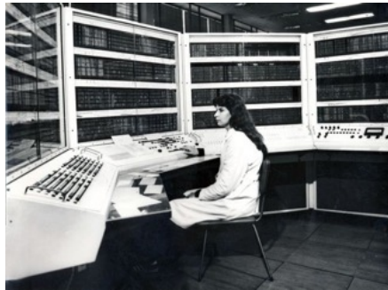
Fig. 1. L'ordinateur soviétique BESM-6 (1965).