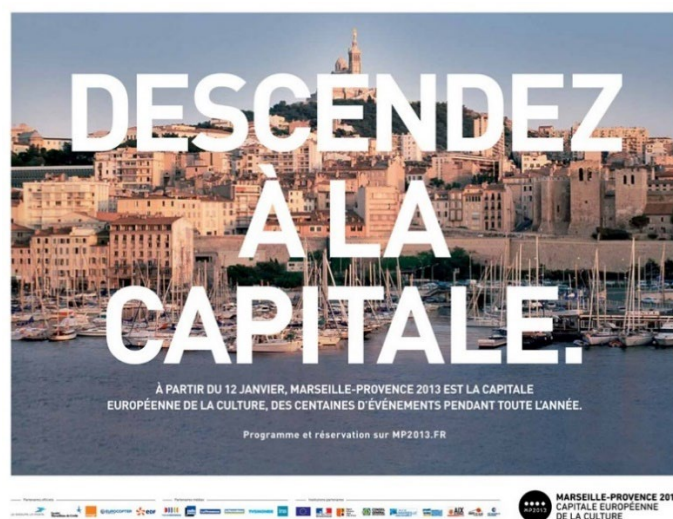
Figure 3 : Exemple d'affiche de communication territoriale pendant l'année MP 2013 21 .

De fait, la réactivité de la CCI MP concernant l'augmentation du budget alloué à la communication autour du grand événement culturel MP 2013 peut s'expliquer a posteriori dans le sens où le titre européen et les initiatives de promotion territoriale qui en découlent, ont effectivement induit plusieurs effets concrets sur l'attractivité et le développement économique du territoire Marseille-Provence.