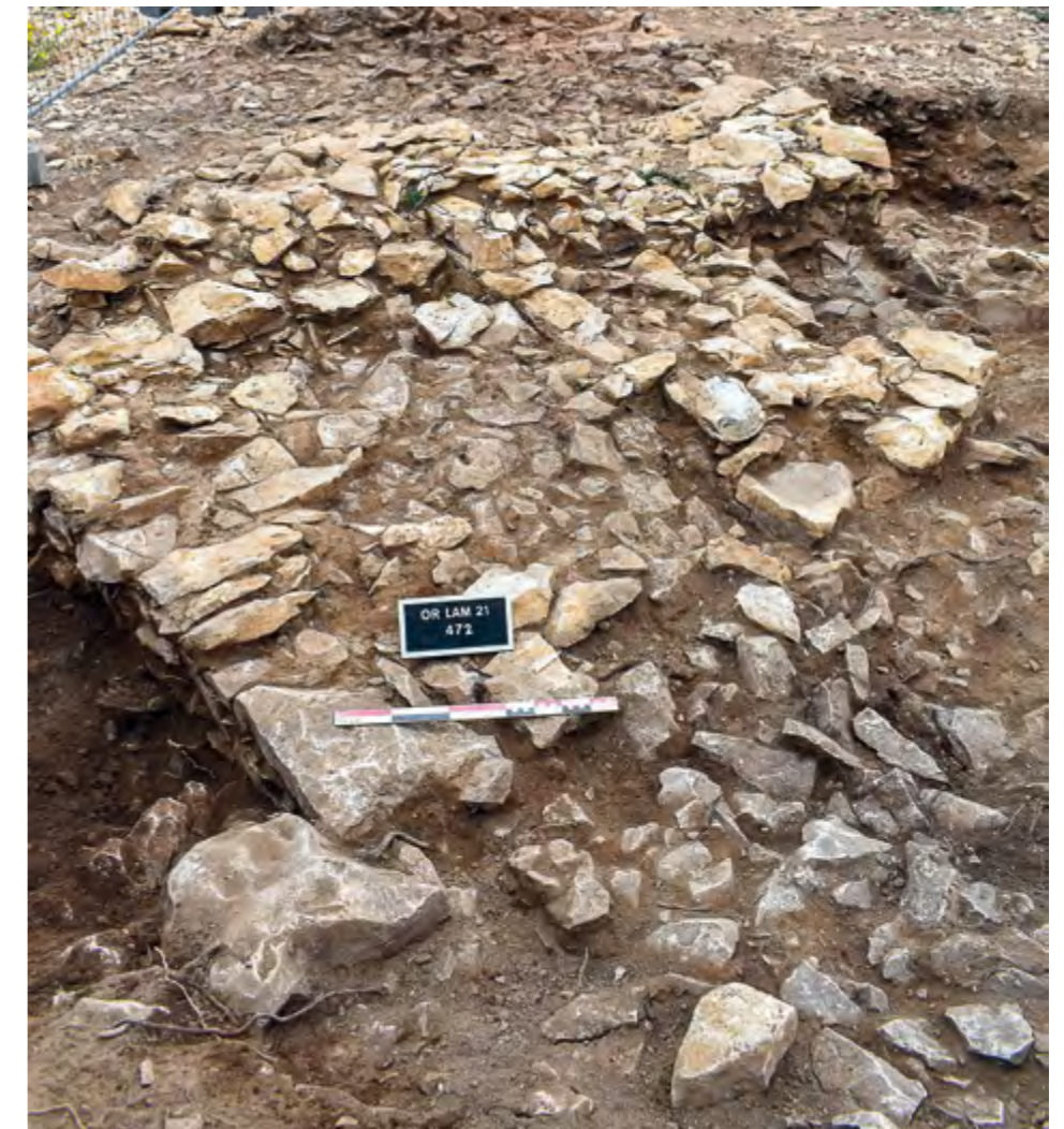
Fig. 204 – ORANGE, PCR « Territoires celtiques et romains autour d'Arausio ». L'angle nord-est du fortin.

clair qu'ils sont le fruit d'un processus complexe, marqué par différentes phases. Ceci transparait notamment