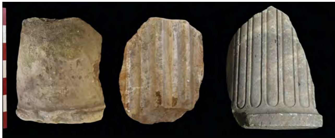
Fig. 203 – ORANGE, Théâtre antique. Trois nouveaux fragments de fûts de colonne en marbre (cliché IRAA).

quité, a subi des transformations. On comprend de mieux en mieux comment le théâtre, loin d'être un monument figé, était un bâtiment en permanente évolution (fig. 202). En ce qui concerne les transformations post-antiques du théâtre, les premiers retours de datations carbone des matériaux végétaux couplés à l'analyse stratigraphique des élévations permettent de commencer à réfléchir à une nouvelle périodisation de l'évolution du théâtre aux époques médiévales et modernes (XIII e , XVI e , fin du XVIII e siècle) qui pourra, à terme, être mise en relation avec l'histoire complexe du château des princes d'Orange qui se dressait au sommet de la colline Saint-Eutrope. Par ailleurs, la redécouverte et le déplacement de l'ancien dépôt de blocs de marbre situé à l'est du monument, entre le théâtre et la rue Pourtoles, enrichissent de manière importante l'étude du décor architectural du front de scène en cours par la découverte, notamment,