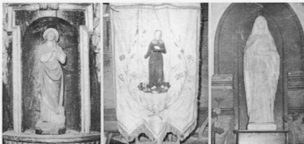
Eglise de Jaignes, iconographie de sainte Geneviève. De gauche à droite : statue de l'autel, bannière et la sainte « à la nef », œuvre moderne.

Eglise dédiée à saint André, détruite à la révolution.