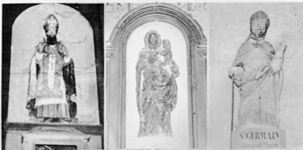
De gauche à droite : Le saint Caprais d'Isles-les-Meldeuses. La Vierge aux raisins de Sammeron. Le saint Germain d'Armentières.

Calvaires : Croix des côtes ou de Saint-Authaire et croix Sainte-Marie (existent actuellement). — Croix de Mollien (lieu-dit), ead., section A, n° 433. — Croix de la plaine , existait jusqu'en 1784 (plan d'intendance A.D. C. 44). — Croix de Beauval (lieu-dit, ead., section C, 168-169, et baux de 1894, faits pour Bahin A. et appartenant à M. Musnier, fermier à Courtablon).