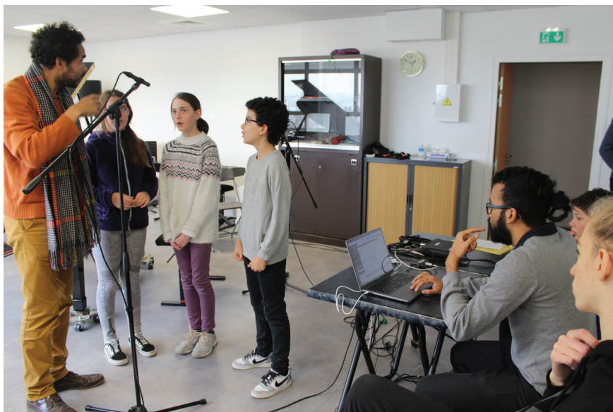
Fig. 3. Improvisation de musique mixte de la classe de chant du conservatoire de Saint-Denis.

Pour l'année universitaire 2020/2021, ce travail de préparation aurait dû aboutir à une session de restitution dans l'auditorium de la Maison des sciences de l'Homme Paris-Nord lors de la conférence FAUST des 1er et 2 décembre 2020, mais également à des créations pour la Biennale du piano collectif le 28 janvier 2021, reportées en raison des restrictions sanitaires. Un premier concert expérimental sous la forme d'ateliers en deux parties a pu être donné les 30 et 31 mars 2021.