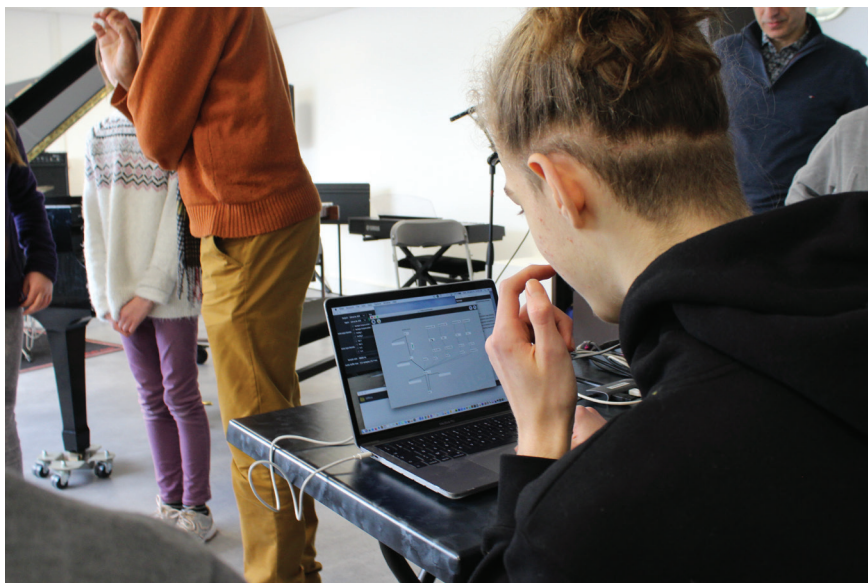
Fig. 4. Manipulation par un élève du conservatoire de Saint-Denis d'un patch Kiwi/FAUST élaboré par un étudiant de l'université Paris 8.

Le gain de cette collaboration est multiple pour les élèves du conservatoire : identification de l'acte compositionnel, participation active à une création musicale, appropriation de langages contemporains, accès à l'informatique et la recherche en musique mais aussi valorisation du territoire dionysien, riche de multiples institutions supérieures.