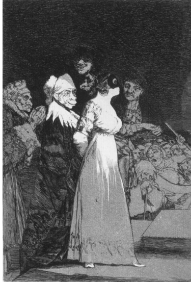
Figure 2 : Goya, Caprices n°2 , « Elles disent oui »

par leurs parents et celle des mariages inégaux. Sur tous ces plans le projet de Goya semble directement influencé par les productions collectives de la minorité éclairée à laquelle il avait été intégré depuis son admission à l'Académie en 1780.