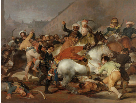
Figure 4 : Goya, Le Deux Mai