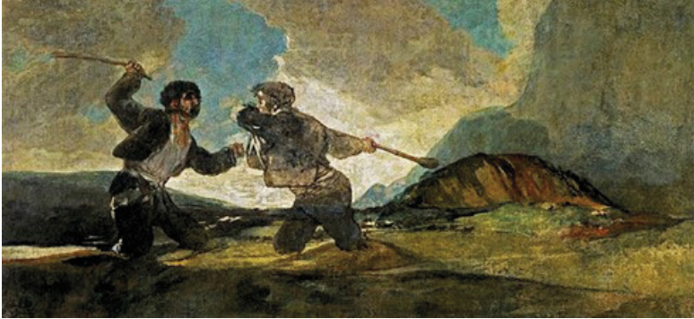
Figure 7 : Goya, Duel à coups de gourdins

Les deux hommes sont prêts à se briser le crâne, Créatures de Dieu, deux Espagnols Accomplissant leur destin.