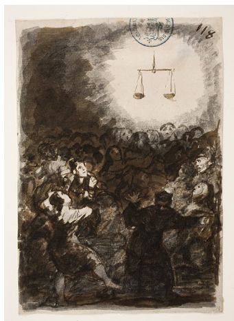
Figure 9 : Goya, Album C 118, « Triomphe de la Justice »