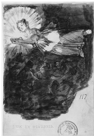
Figure 8 : Goya, Album C 117, « Lux ex tenebris »