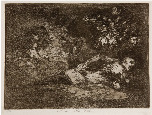
Figure 5 : Goya, Désastres de la guerre 69 , « Rien. Cela le montrera »