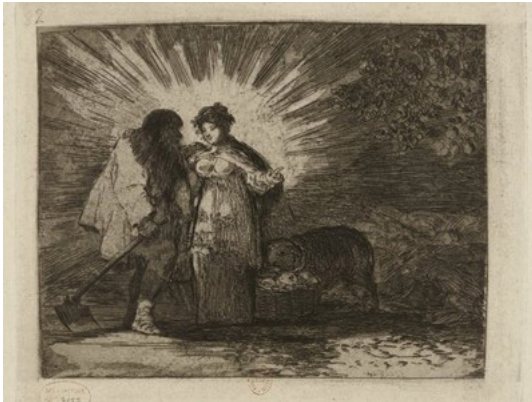
Figure 6 : Les Désastres de la guerre 82, « Voilà la vérité »

Elle lui montre le ciel incandescent, inondé de lueurs, l'avenir qui s'avance, avenir à la fois splendide et doux, l'abondance, la justice, le calme, la sérénité et la force... C'est l'idée de Fourier, celle de Saint-Simon, la théorie de Jean Reynaud, l'Icarie heureuse, Proudhon, Cabet, tous les utopistes honnêtes que préoccupe l'amour de l'humanité, et tous les réformateurs à l'état embryonnaire pressentis à la fin du XVIII e siècle en Espagne par un peintre isolé dans une société ignorante et fanatique. »