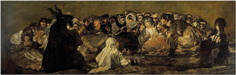
Figure 3 : Goya, Le sabbat des sorcières (1823)

que c'est cette double appartenance, propre au sujet culturel, qui fait l'originalité de la personnalité de Goya et de sa production. Mais, pour en revenir au rapport posé par Bourdieu sur lequel s'est ouverte notre première partie, on peut affirmer que le langage de la dissidence que Goya investit dans les Caprices est en contradiction avec l'univers social dans lequel il évolue, et cela explique la réception négative de l'œuvre, tant au niveau du nombre des exemplaires de la collection vendus (27 sur un tirage de 240) qu'au niveau des menaces inquisitoriales qui amenèrent Goya à se placer sous la protection du Roi en lui faisant don des exemplaires invendus.