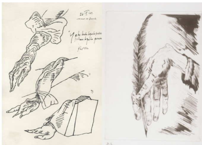
Figuras 11 y 12

José Luis Cuevas, Manos de Quevedo , 1969, dibujo a pluma sobre papel