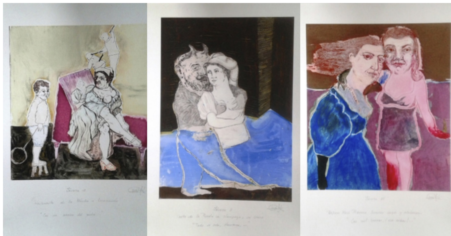
Figuras 4, 5, 6

Amabel Míguez de la Sierra, Respuesta de la Méndez a Escarramán , Carta de la Perala a Lampuga su bravo y Refiere Mari Pozorra honores suyos y alabanzas , 2011, técnica mixta.