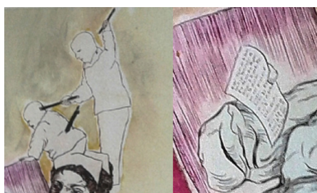
Figuras 15 y 16

El desfase de proporciones entre la Méndez, sentada en un sofá con vestido que deja brotar el pecho izquierdo, y los dos personajes que están a nivel de su cabeza dan a entender que el receptor está asistiendo a los pensamientos de la iza, quien acaba de redactar la carta que percibimos en el respaldo del sillón (Fig. 16); además, está «Con un Menino del padre» en la parte izquierda de la obra, lo cual retoma el incipit de la misma jácara. Esta segunda ilustración se ajusta pues al hipotexto escritural de Quevedo a la vez que autocita parte de la primera ilustración.