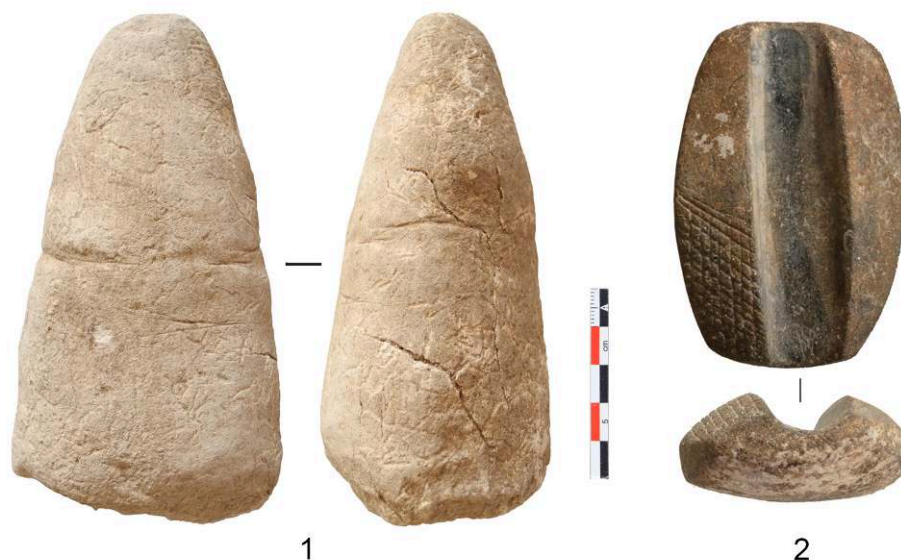
Fig. 7. Objet conique sculpté dans du calcaire crayeux et pierre à rainure provenant des niveaux d'occupation PPNA.