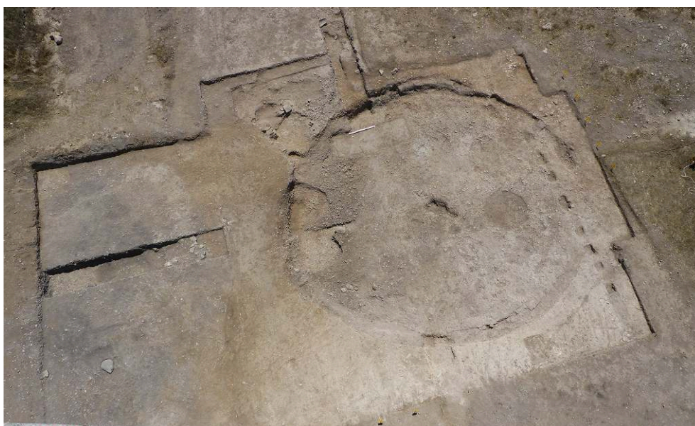
Fig. 1. Le bâtiment collectif St 10 dans le secteur central à la fin de la campagne 2012

édifice en partie creusé dans le substrat géologique comportait, sur sa périphérie interne, une tranchée servant d'assise à un mur de terre crue plaqué contre l'encaissant 3 . Un dispositif d'entrée ouvre vers le nord-est. Cette grande construction mise en évidence à Klimonas correspond à une catégorie d'édifices connus en Turquie, Syrie, Irak, Palestine et Jordanie, qualifiés, en raison de leur volume et de leur originalité, de "bâtiments communautaires". La comparaison avec les quelques monuments levantins connus démontre que, dès les débuts du Néolithique, Chypre était partie prenante d'une même « ambiance culturelle » qui affectait alors le Levant-Nord.