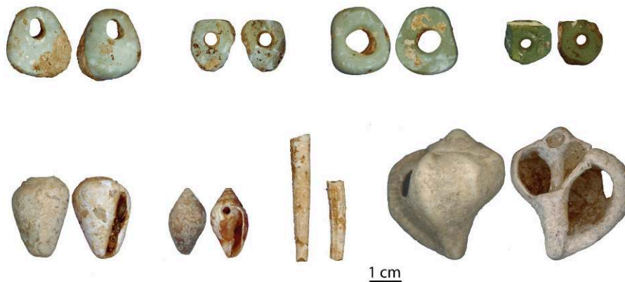
Fig. 6. Éléments de parure en picrolite et en coquillages marins.