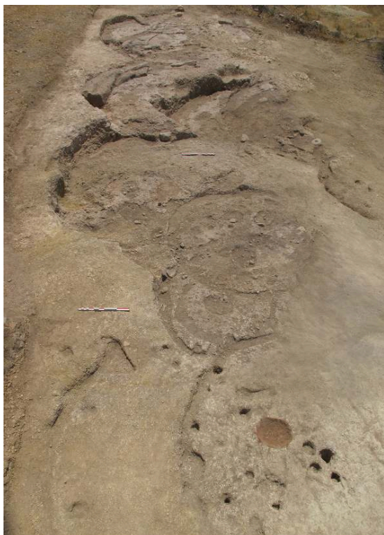
Fig. 3. L'extension sud du village néolithique dans le secteur B à la fin de la campagne 2016

moyenne haute des villages PPNA du Levant, et, de par son insularité, constitue donc un site majeur pour cette période.