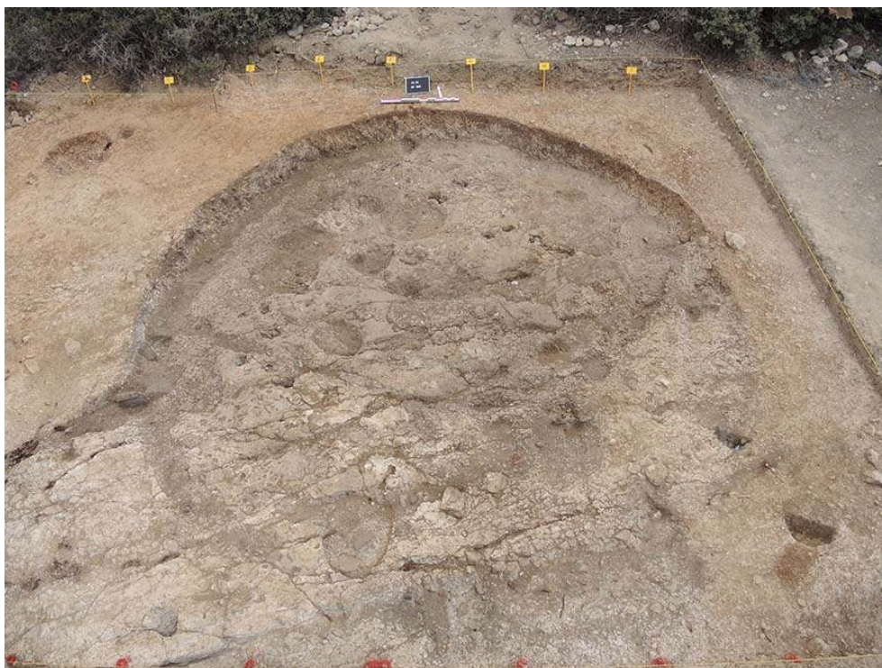
Fig. 2. Le bâtiment St 800 dans le secteur F à la fin de la campagne 2015