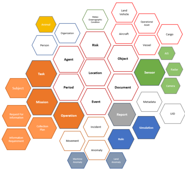
FIGURE 1 – Aperçu des vocabulaires du modèle de base CISE (entités en blanc) et du modèle eCISE (entités CISE enrichies par les entités en couleur).

xs:complexContent . Ils sont listés dans l'ordre où ils doivent apparaître dans une balise xs:sequence . Chacun de ces éléments correspond soit à une propriété propre à l'entité, soit à une association avec une autre entité. L'extrait ci-dessous décrit l'entité Vehicle comme une sous-classe de Object liée à l'entité Cargo par une association représentée en XML par la propriété CargoRel ; la valeur explicite 0 de xs:minOccurs et la valeur implicite 1 de xs:maxOccurs indiquent une cardinalité de 0,1; la propriété est donc facultative et ne peut apparaître qu'une fois. Il est à noter que Cargo désigne une cargaison (i.e., un ensemble de marchandises transporté par un véhicule entre deux ports), et non un type de bateau.