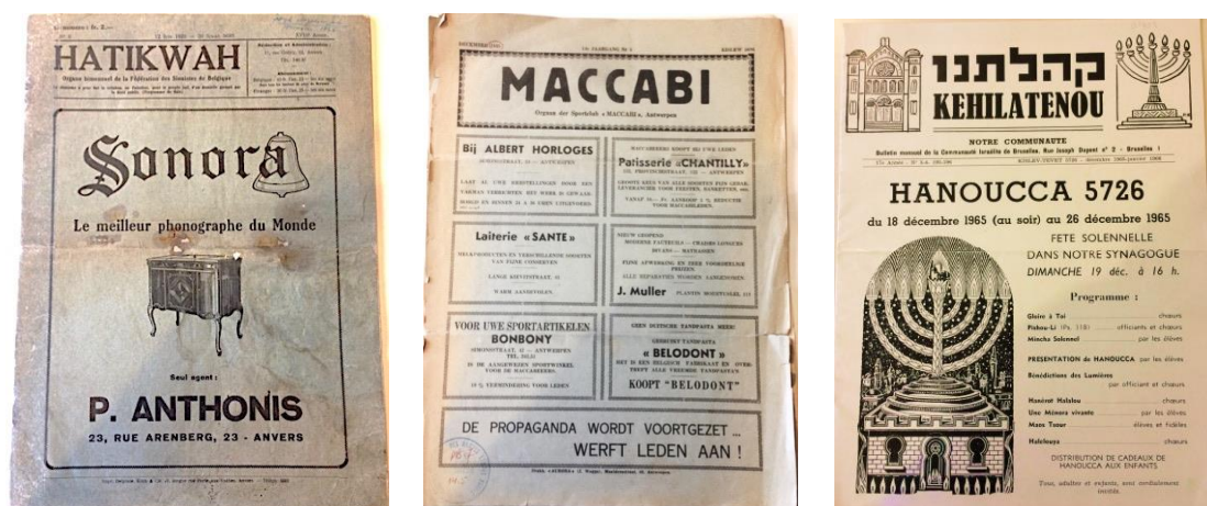
Organes de la presse juive, Hatikwah , Maccabi et Kehilatenou contenant des annonces et des nouvelles socio-culturelles.

cette même année dans Hatikwah 26 – l'organe bimensuel de l'organisation sioniste belge – invite déjà les volontaires à rejoindre ses rangs encore dépourvus de violoncellistes, d'altistes et de flûtistes, leur assurant « les plus grandes facilités dans l'étude ou l'acquisition de l'instrument choisi 27 ». Si les sources sont rares concernant la personnalité de ce bâtisseur violoniste et compositeur occasionnel 28 , ses performances ont été régulièrement relayées par la presse juive et nationale, dont une sélection est également disponible au Musée Juif de Belgique.