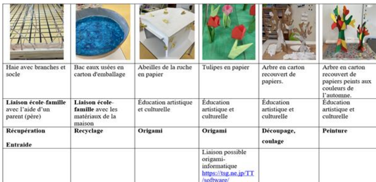
Illustration 6 : Traces des productions de classe sur les billets 4 et 5 du blog des CP-CE1

Les décorations du plateau de jeu des robots mettent en lumière des liaisons école-familles au service d'une éducation au recyclage. Nous pouvons identifier aussi de l'éducation artistique et culturelle notamment par le travail de peintures sur créations d'arbres avec du papier mâché. Enfin, le travail par origami pourrait engendrer un travail sur les liens entre cet art et la programmation de modèles d'origami dans le champ de l'informatique.