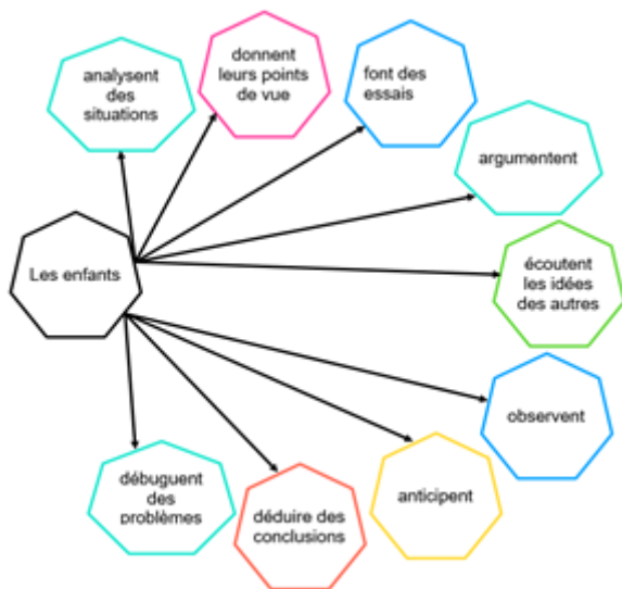
Illustration 3 : Compétences de base nécessaires dans tous les domaines ciblé par le cahier des charges du 6 e projet SQYROB