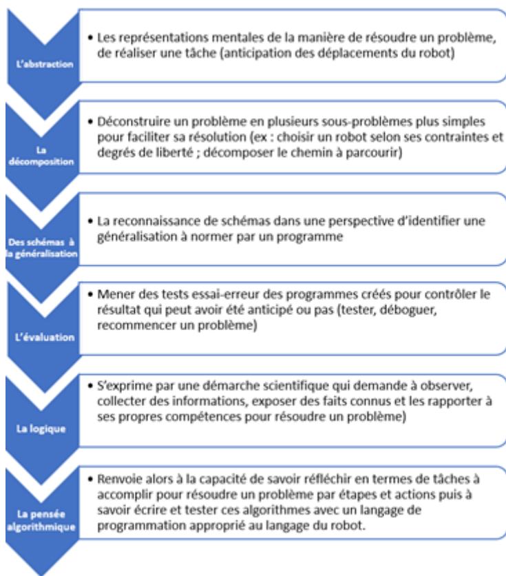
Illustration 2 : Les six étapes à décrire dans le modèle de la tâche pour mener le projet robotique dans le champ de l'informatique à l'école primaire