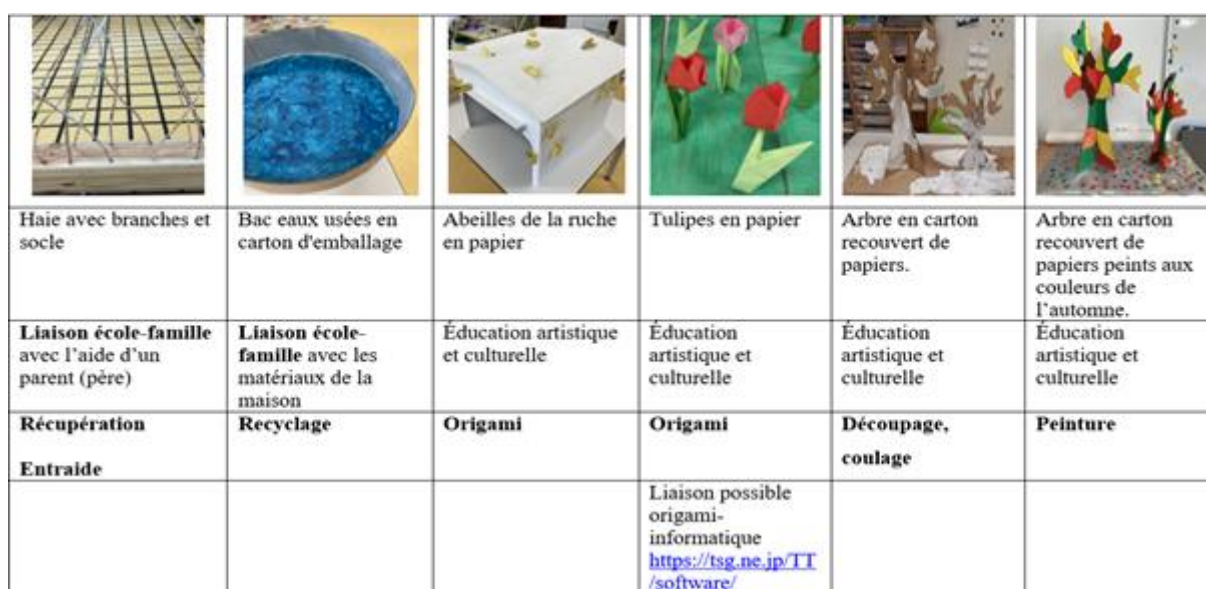
Illustration 6 : Traces des productions de classe sur les billets 4 et 5 du blog des CP-CE1

Les décorations du plateau de jeu des robots mettent en lumière des liaisons école-familles au service d'une éducation au recyclage. Nous pouvons identifier aussi de l'éducation artistique et culturelle notamment par le travail de peintures sur créations d'arbres avec du papier mâché. Enfin, le travail par origami pourrait engendrer un travail sur les liens entre cet art et la programmation de modèles d'origami dans le champ de l'informatique.