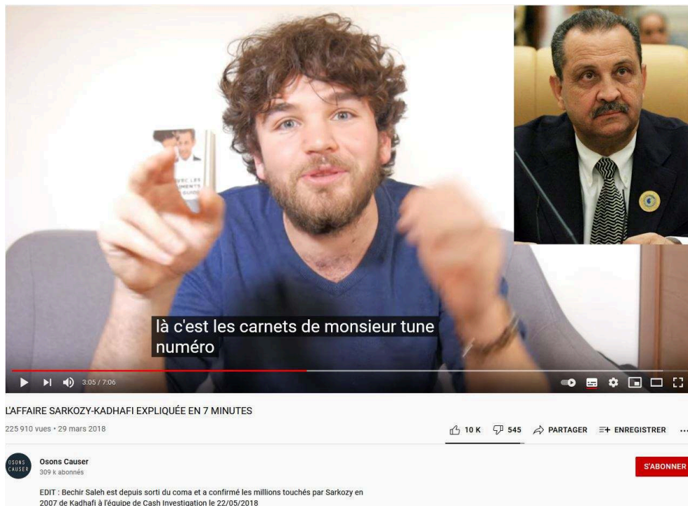
Figure 2 : Exemple de multimodalité numérique dans un vlogue