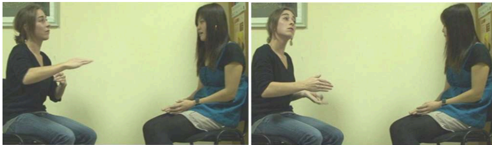
Figure 4 : Orientation du regard pendant une recherche lexicale multimodale (Stam &amp; Tellier, 2017)