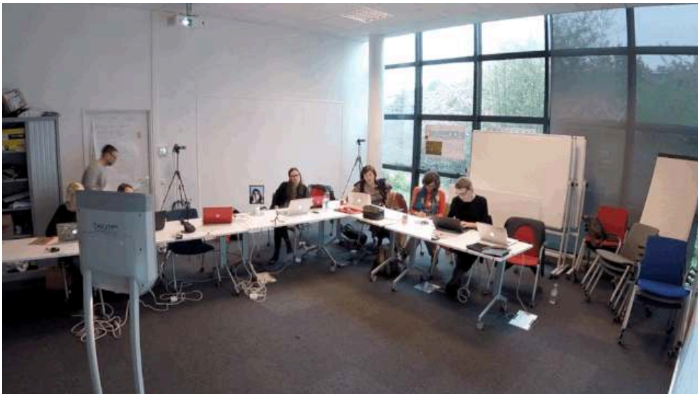
Figure 3 : Gif animé illustrant dans l'édition augmentée un exemple d'acte de coopération dans l'interaction ( ibid. )