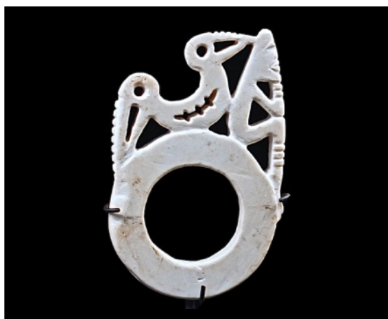
Illustration de la couverture :