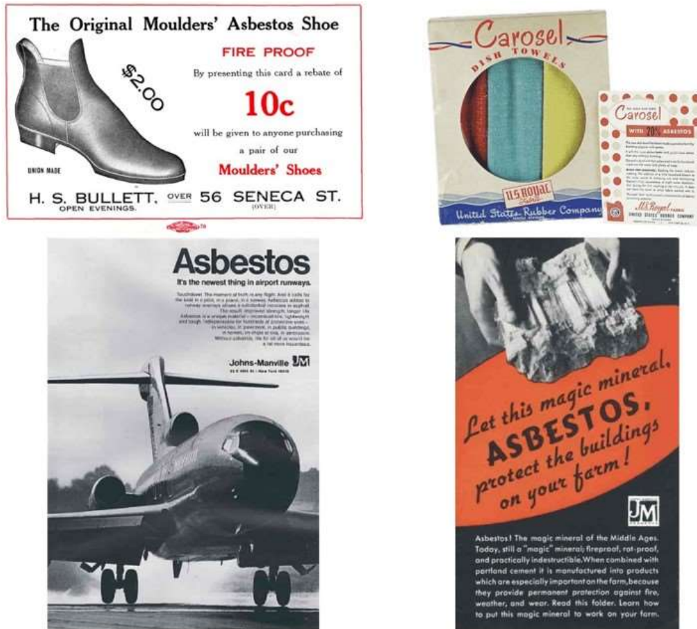
Figure 2. L'amiante, objet de campagnes publicitaires tous azimuts