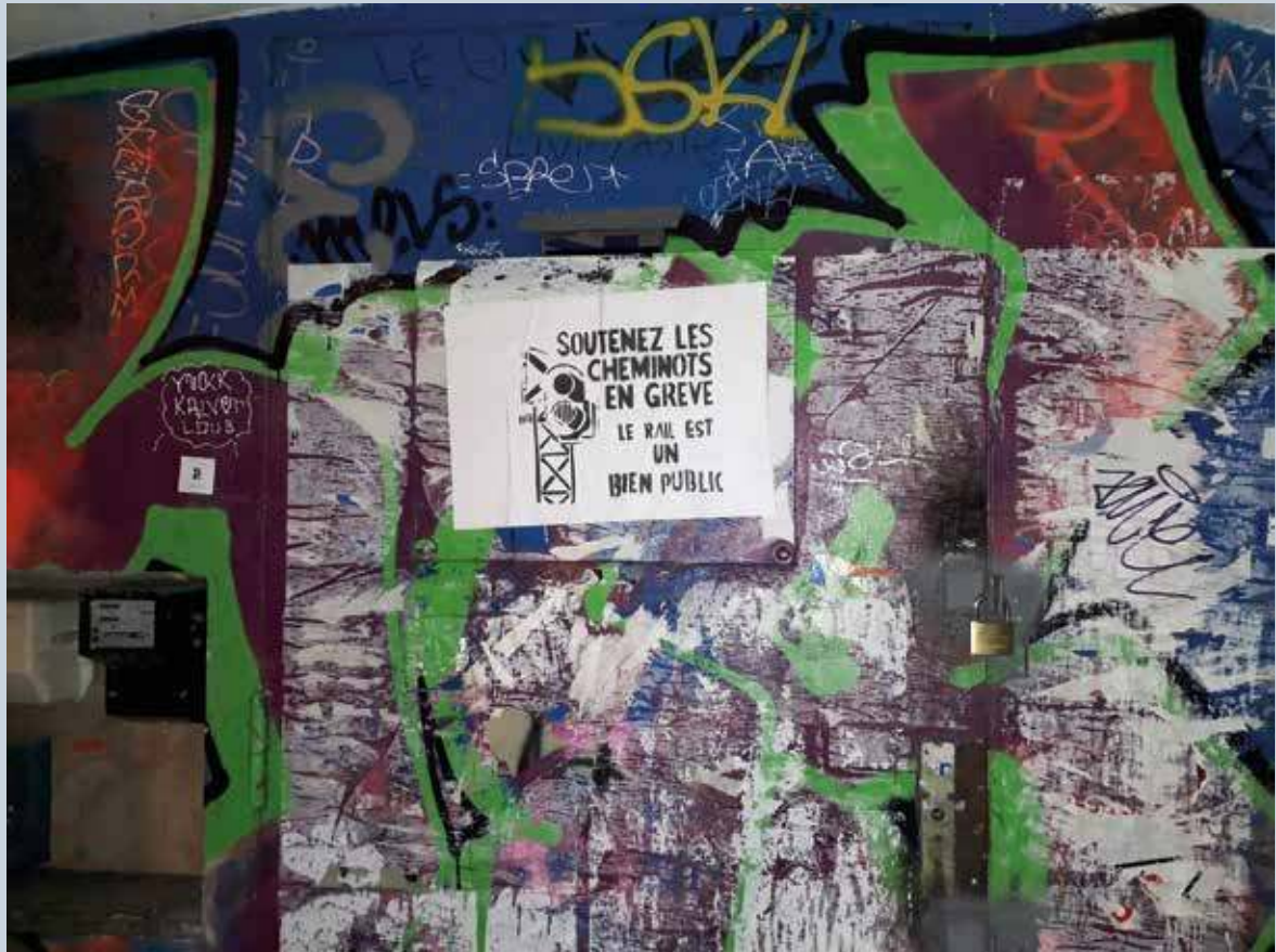
5. Affiche (rue des Trois Mages) collée sur le parcours du 19 avril 2018 par des participants au « cortège de tête » lors d'une journée d'action contre l'ouverture à la concurrence du rail