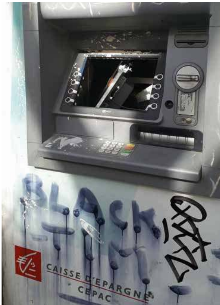
6. Photo prise près de la place Jean-Jaurès à la suite d'une manifestation sauvage en mars 2019

de mai 68 est très régulièrement réutilisée par les personnes qui prennent part au mouvement, par exemple en détournant des affiches ou en reprenant des slogans célèbres de cette période. Des moments insurrectionnels qui ont marqué l'histoire comme la Commune de Paris ou les révolutions françaises, sont aussi fréquemment évoqués.