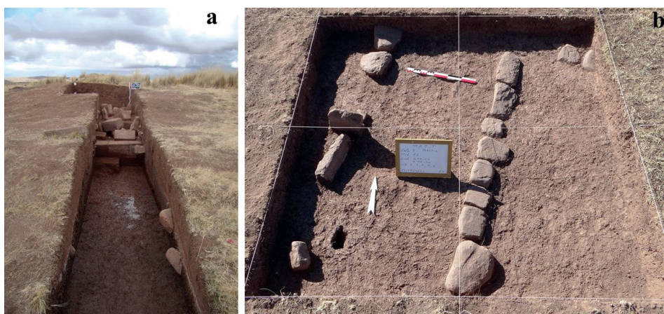
Figura 2. Las unidades de excavación. a) Vista del Montículo de la Laguna en Wila Pukara (Cala 1), b) Alineamientos en la pampa de Pokotia (Cala 3) (fotografías: MAP-T 2014).

arqueológicos Wila Pukara y Pokotía. Se analizaron contextos arqueológicos domésticos y ceremoniales correspondientes al período Tiahuanaco (IV - V) que cronológicamente abarca del 500 al 1100 DC e Intermedio Tardío Pacajes del 1100 - 1400 DC. El objetivo general de la investigación arqueozoológica fue estudiar las características de la fauna de Wila Pukara y Pokotia entre 500 DC y 1400 DC. Los objetivos específicos fueron: