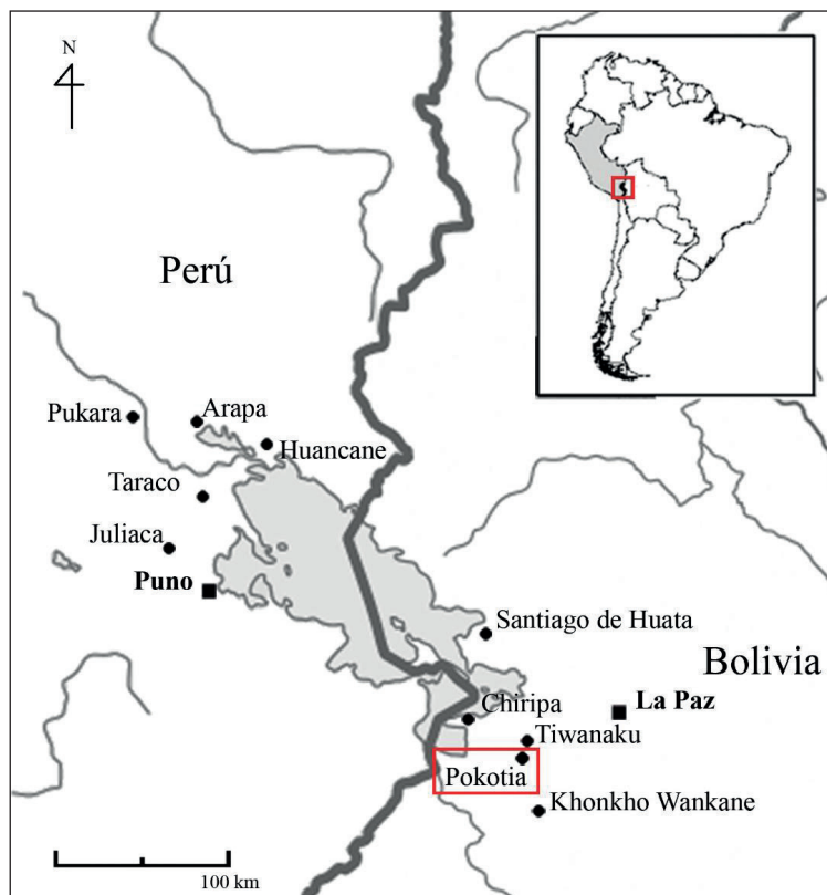
Figura 1. Mapa regional de ubicación (infografía: F. Cuyet).