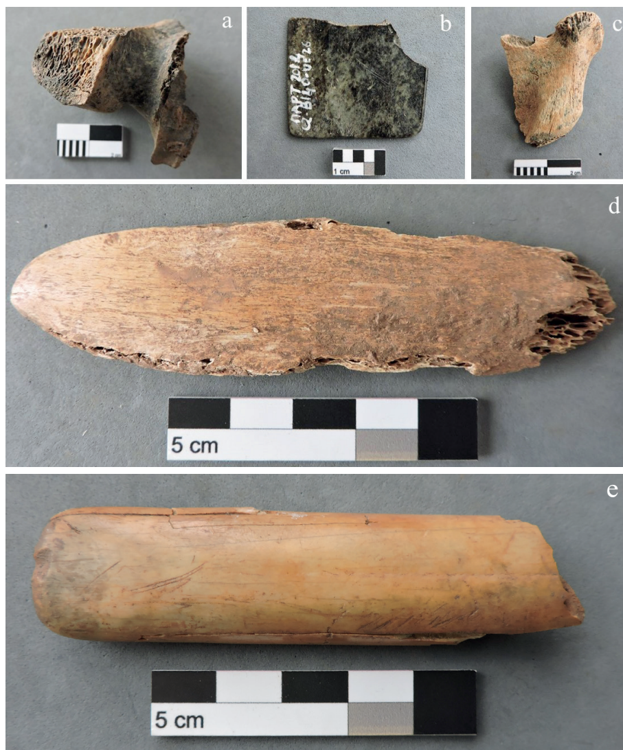
Figura 4. Especímenes con modificaciones antrópicas a) Ejemplo de trozado, b) Ejemplo de placa, c) Raspador en mandíbula de camélido, d) Raspador en costilla o lizo, e) Artefacto sobre metapodio o wichuña.