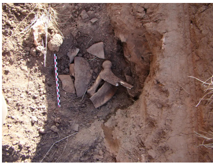
Restes humains issus de l'une des nombreuses sépultures détruites par le passage des machines de terrassement.

Mais dans le même temps, il serait hypocrite de tomber des nues face à cette situation car il s'agit là d'un secret de polichinelle dont tous les acteurs – les institutions et les archéologues en premier lieu – sont parfaitement conscients depuis des décennies. Ce cri d'alarme pose le constat clair et sans complaisance d'une nécessaire évolution des mentalités et des pratiques en faveur d'un objectif commun qui permettrait une meilleure protection du site archéologique de Tiwanaku.