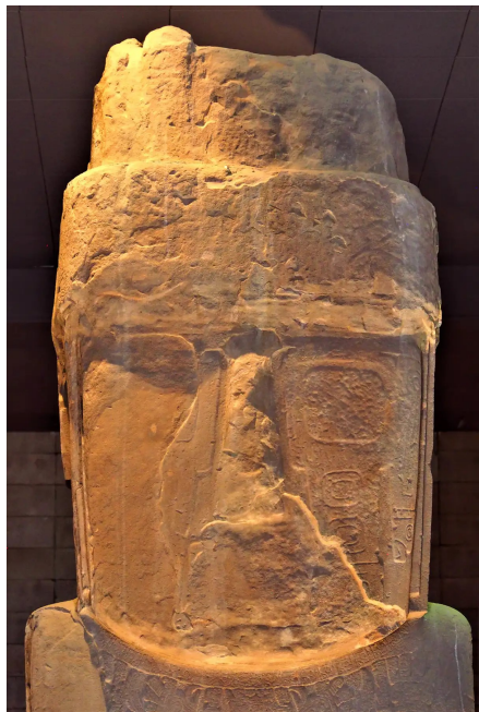
Détails de l'usure sur la face du Monolithe Bennett. Musée Lithique de Tiwanaku, MAPT 2018/CIAAAT/MEAE, Author provided

Découverte couchée lors des travaux entrepris par l'archéologue Wendell Bennett en 1932 au sein de l'ancienne cour excavée de Tiwanaku, cette magnifique pièce de la statuaire Tiahuanaco fut réalisée en un seul bloc de grès dépassant les sept mètres de hauteur, ce qui en fait la plus grande sculpture préhispanique découverte à ce jour en Amérique du Sud. Par la suite, le monolithe fut déplacé du site de Tiwanaku jusqu'à la proche capitale de La Paz pour y être exposé en plein cœur du centre-ville. Ce déracinement eut des conséquences néfastes sur la préservation de la sculpture. En effet, durant des décennies, la roche fut irrémédiablement endommagée par les gaz d'échappement et les pluies acides causées par le développement du parc automobile, entraînant dans certains cas la disparition partielle des délicats motifs incisés à sa surface.