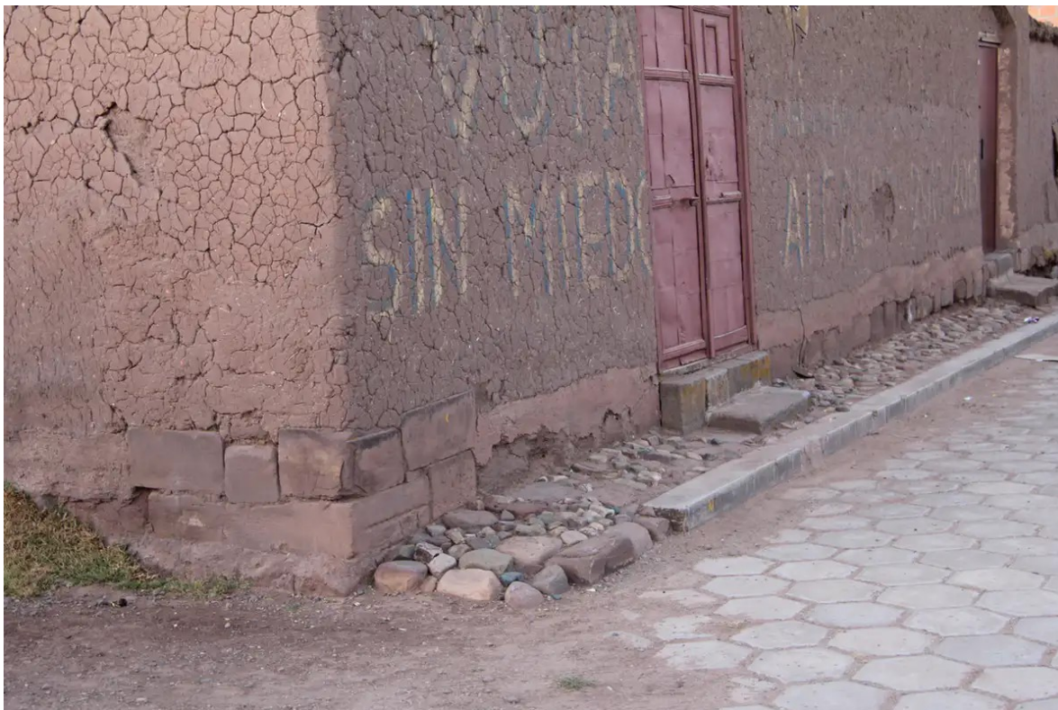
Remploi de blocs provenant de structures antiques au sein de l'habitat de l'actuel village de Tiwanaku. François Cuyenet

Mais dans le même temps, il serait hypocrite de tomber des nues face à cette situation car il s'agit là d'un secret de polichinelle dont tous les acteurs – les institutions et les archéologues en premier lieu – sont parfaitement conscients depuis des décennies. Ce cri d'alarme pose le constat clair et sans complaisance d'une nécessaire évolution des mentalités et des pratiques en faveur d'un objectif commun qui permettrait une meilleure protection du site archéologique de Tiwanaku.