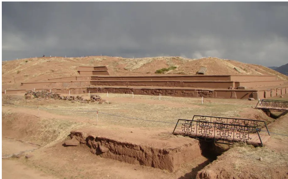
La pyramide Akapana de Tiwanaku.