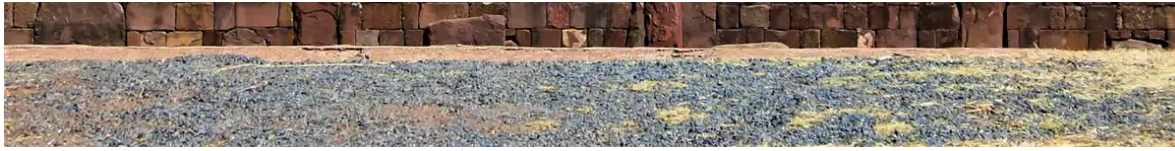
L'entrée du Kalasasaya restaurée.

Un même constat d'incertitude peut être fait concernant l'ancienne cour excavée de Tiwanaku. Dès le premier coup d'œil, le visiteur peut s'apercevoir que parmi la multitude des pierres d'appareillage et des sculptures parfaitement intégrées aux murs de la structure, certains visages se distinguent par leur forme et leur apparence plus grossière. Et pour cause, puisqu'en réalité ces derniers n'étaient pas à l'origine présents à cet emplacement, mais furent retrouvés gisant sur le sol de la cour (très probablement déposés en offrande à cet endroit au moment du scellement de l'espace rituel).