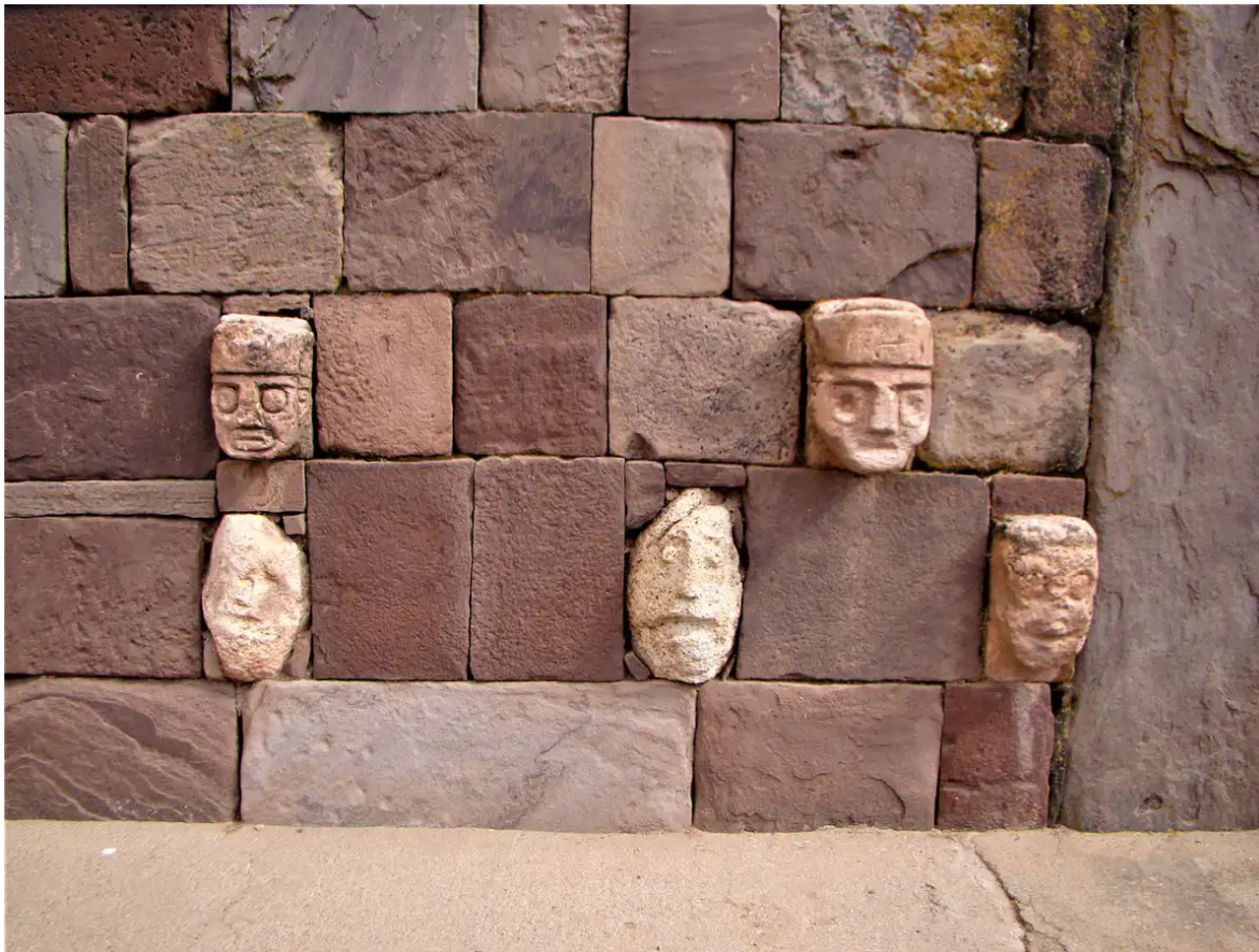
Têtes-tenons de la Cour Excavée de Tiwanaku. François Cuyenet (MAPT 2013/CIAAAT/MEAE), Author provided