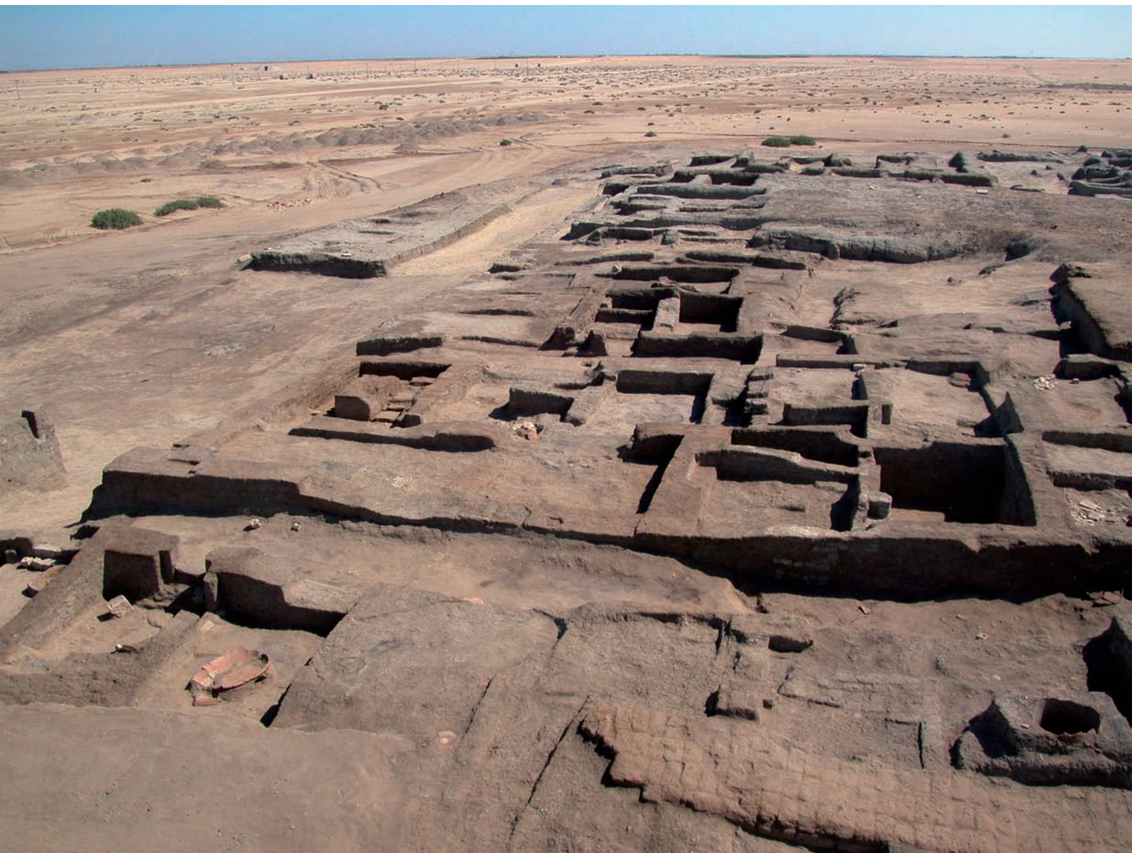
fig. 10 (page de droite)

Si les constructions de la phase VB se superposent à celles de la phase précédente (phase VI), directement sur les arasements des constructions antérieures, celles de la phase suivante, du tournant du IV e siècle av. J.-C.