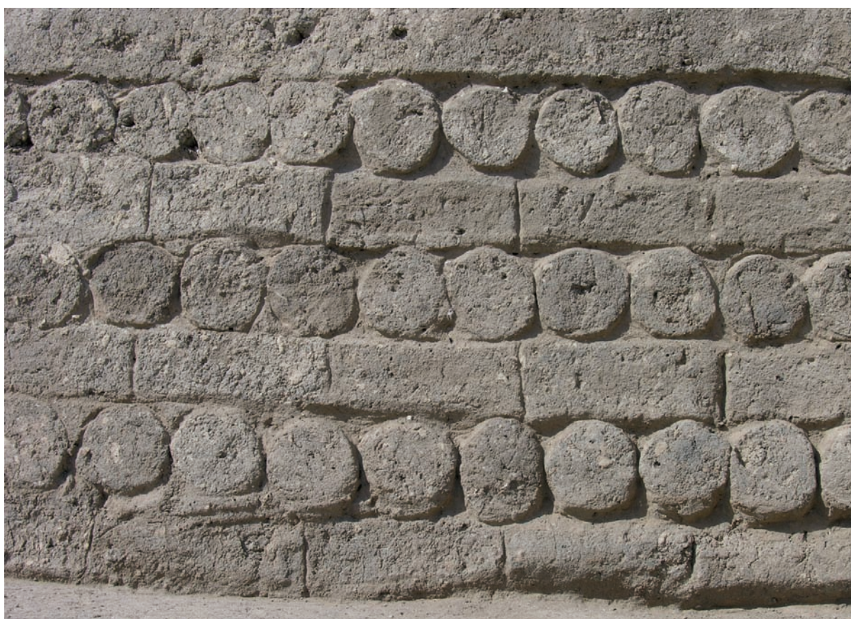
fig. 1 Fondations en briques cruées de forme cylindrique.

Situé aux confins du delta oriental, sur la seule route terrestre reliant l'Égypte à la Palestine (les "Chemins d'Horus"), Tell el-Herr fut l'un des poste-frontières majeurs de l'Égypte achéménide. Édifié dans les premières décennies du v e siècle av. J.-C., ce site connu, dès