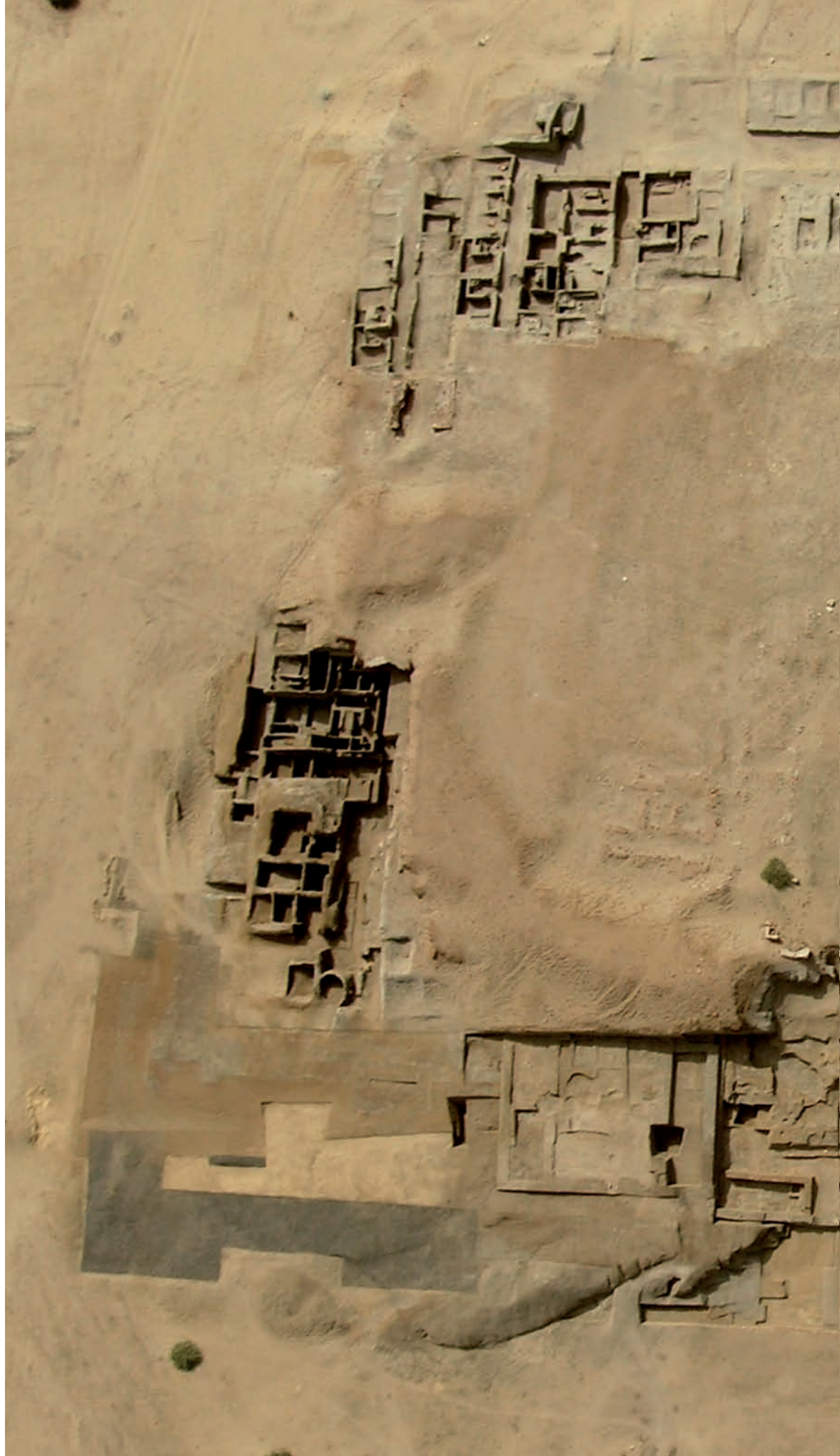
fig. 3 (ci-contre) Vue aérienne des forteresses.