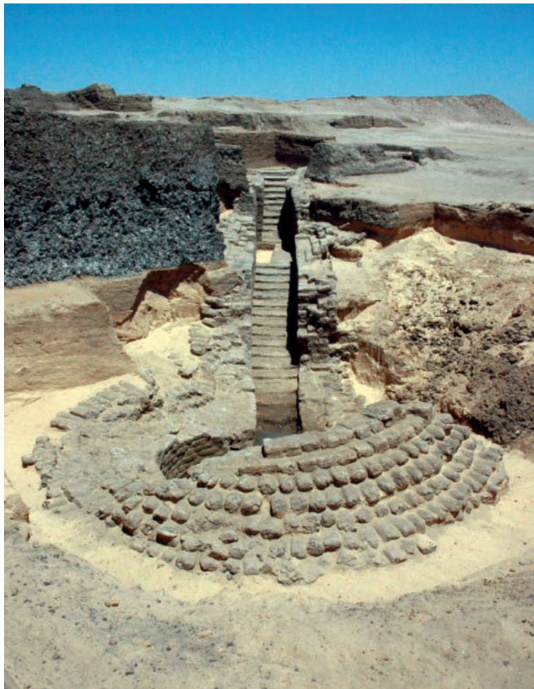
fig. 8 Construction hypogée de la première moitié du V e s. av. J.-C., au nord-est du tell.

Si la fouille incomplète rend incertaine la compréhension de la nature et la fonction du monument, son plan évoque fortement celui des tombes à tholos de la Macédoine, dont des exemples assurément datés du V e siècle av. J.-C. offrent des points de comparaison.