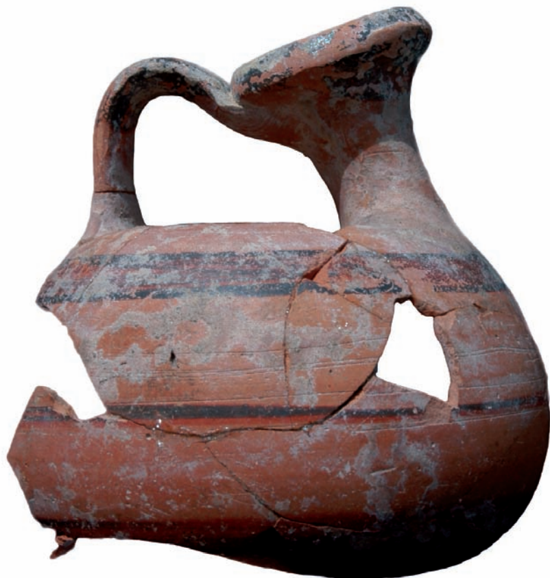
fig. 12 Askos attique (Inv. n°. TEHP05/001), v e s. av. J.-C. © Mission franco-égyptienne de Tell el-Herr, J.-M. Yoyotte.

Vecteurs commerciaux et jalons chronologiques, les amphores connaissent diverses attestations sur le site, dans les espaces dévolus à leur consommation, dans les espaces réservés à leur conservation [fig. 6], puis dans les locaux indiquant leur réemploi. Elles proviennent majoritairement de la mer Égée, de Chypre,