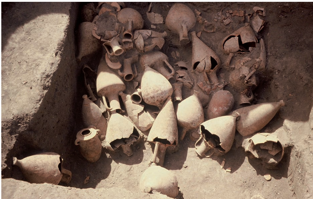
fig. 6 Un ensemble amphorique du dernier quart du v e s. av. J.-C.

C'est dans ce secteur particulièrement éprouvé par les pillages des sebakhins que d'importants dépôts d'amphores ont été découverts, plus à l'est. Le plus complet d'entre eux 15 , aménagé sur plusieurs niveaux, dans un espace étroit et clos, délimité par d'épais murs de briques crues, comportait plus de 80 jarres et amphores provenant des centres réputés du pourtour méditerranéen oriental [fig. 6] : Chios, Thasos, Mendè, Milet-Samos, Sidon y prédominent, tout comme d'autres cités majeures de la péninsule chypriote et de la Phénicie méridionale ( infra ). Leur datation précède de peu l'extension de la deuxième enceinte et l'organisation d'un nouveau tissu urbain. À l'extrémité du tell, au sud-est, un impressionnant dispositif de stockage 16 occupait l'angle intérieur de la forteresse [fig. 7]. Formé de murs épais et puissants (entre 1,20 et 1,50 m de large), l'édifice, accessible depuis une rue au nord, couvre une superficie actuelle d'environ 340 m 2 ; sa façade mesurait plus de 21 m de long. Il est conservé sur quelques mètres de haut et se compose de plusieurs pièces dépourvues