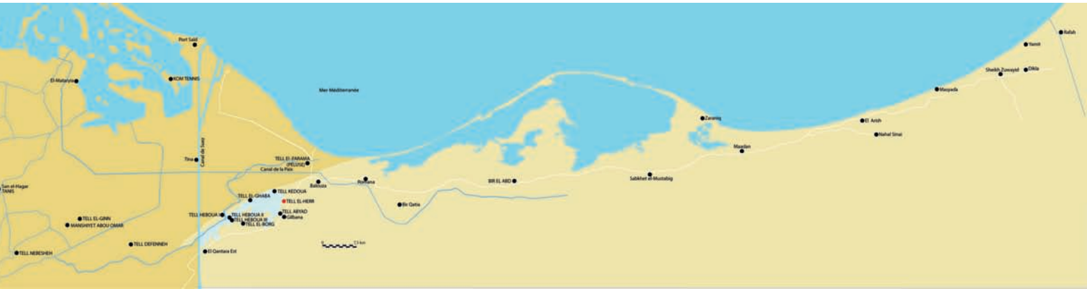
fig. 2 (ci-dessus) Carte du Nord-Sinaï. Détail (page de droite)