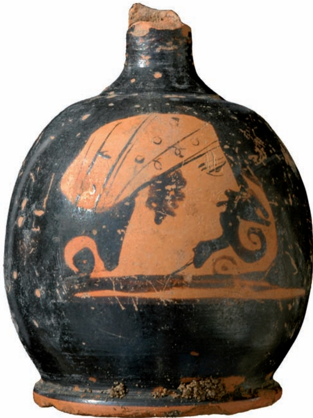
fig. 11 Lécythe à figures rouges, tête féminine, fin v e s. av. J.-C.

Le plan de l'édifice central et l'organisation interne des pièces confirment l'originalité de ce modèle architectural dans la région. Une origine étrangère lui est attribuée, et, qui plus est, une origine assyrienne.