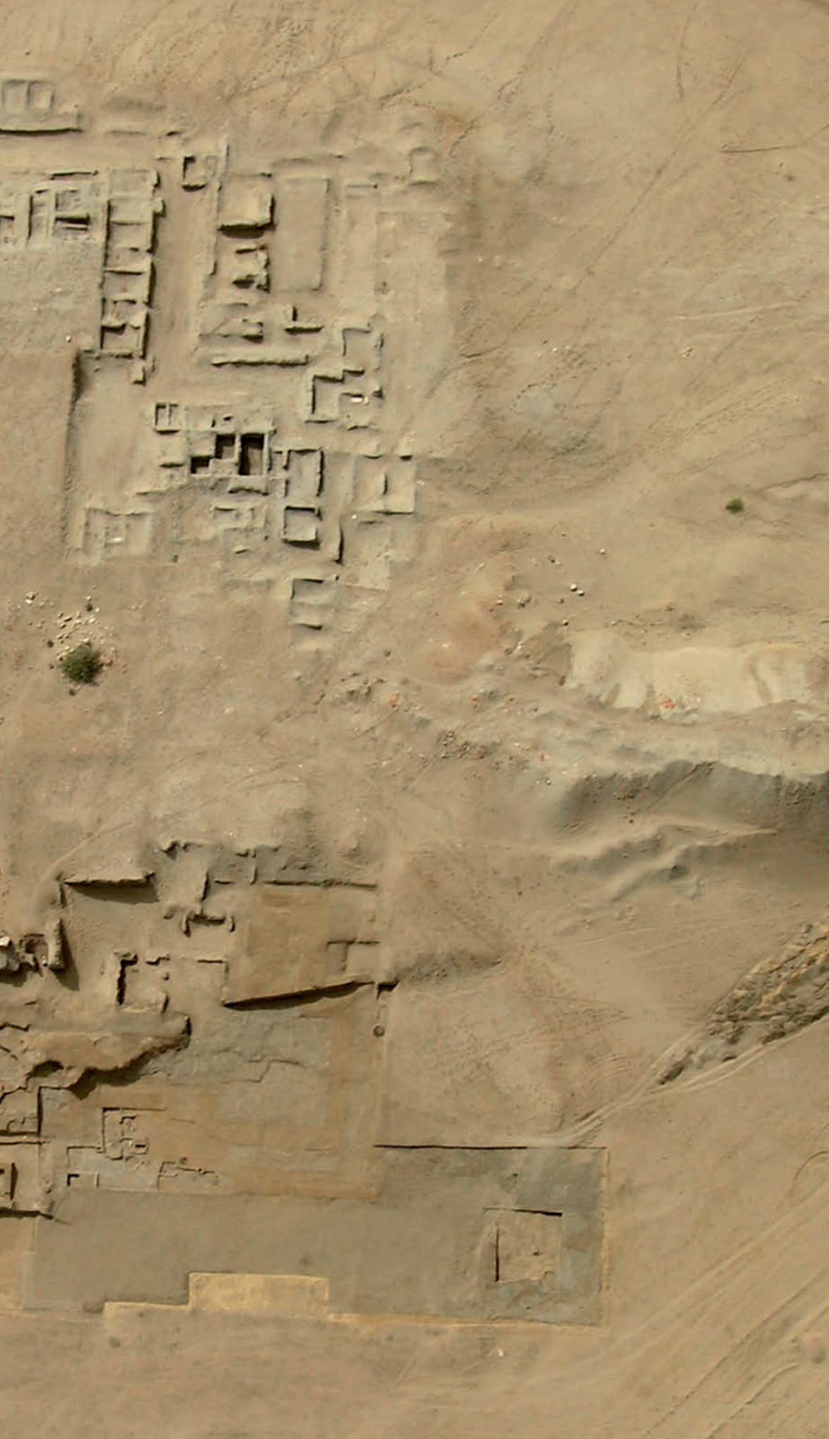
fig. 4 (page suivante)

Vue générale du quartier dans l'angle nord-est de la première forteresse perse.