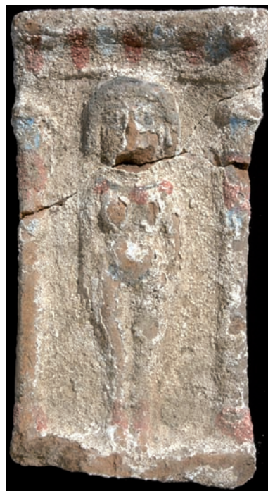
fig. 15 (ci-dessus) Figurine féminine dans son naos, calcaire (Inv. n°. TEH05/123).

En effet, les amulettes, perles, bijoux et autres éléments de parure dominent le petit mobilier archéologique : environ plus de mille objets recensés. Les amulettes sont nombreuses et, comme dans d'autres sites contemporains, les plus répandues sont les amulettes de Bès et les amulettes d'œil-oudjat 32 [fig. 16]. Une grande diversité les caractérise et dénote leur importance dans le quotidien des occupants du tell, tout groupe ethnique confondu : selon leur module et leur aspect, elles se répartissent entre simples talismans apotropaiques et écarteurs de colliers. Aussi remarquables dans leur finesse et leur précision d'exécution sont d'autres trouvailles en calcaire, en pâte de verre, en os et, plus sporadiquement, en métal, incluant des amulettes de Thoueris, de Bastet, d'Isis et Horus, de Maât, de Thot et de Nefertoum. La variété iconographique qu'elles offrent est étendue et des versions un peu éloignées des types classiques confirment l'originalité de ce matériel sur le site et dans la région.