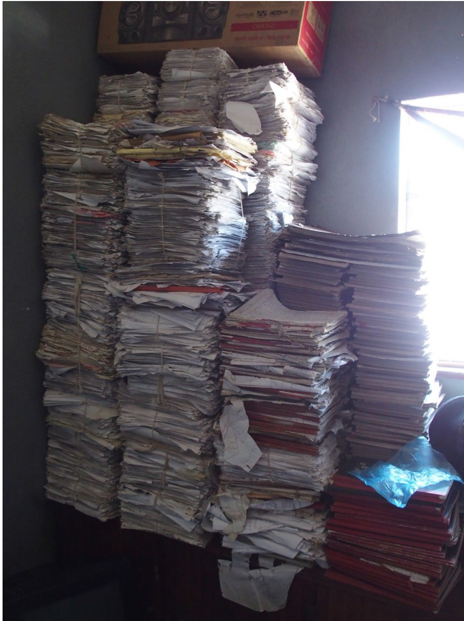
Image 4: Entassement des papiers aux archives du poste de police de Ndirande

des statistiques et à guider des politiques publiques 96 . Elle n'existe en somme que par sa fonction de simplification des rapports entre fonctionnaires et usagers.