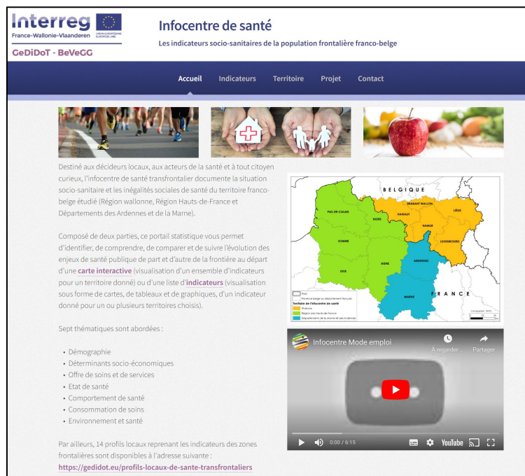
Figure 4. Page d'accueil de l'InfoCentre GeDiDot ( https://infocentre-sante.eu/index ).