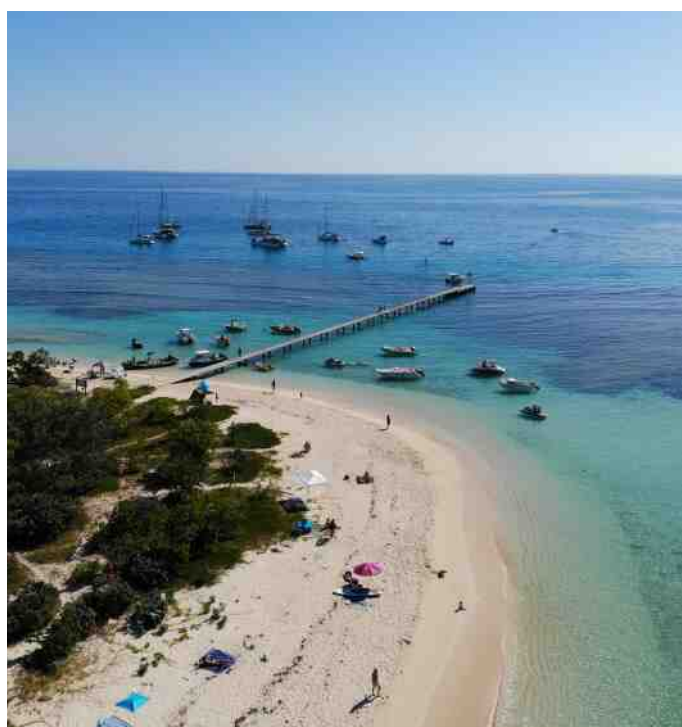
Mouillage dans les zones d'usage à l'îlot Signal, Nouvelle-Calédonie

Les codes provinciaux sont la source la plus importante pour déterminer si des normes en matière de suivi du milieu marin peuvent être imposées.