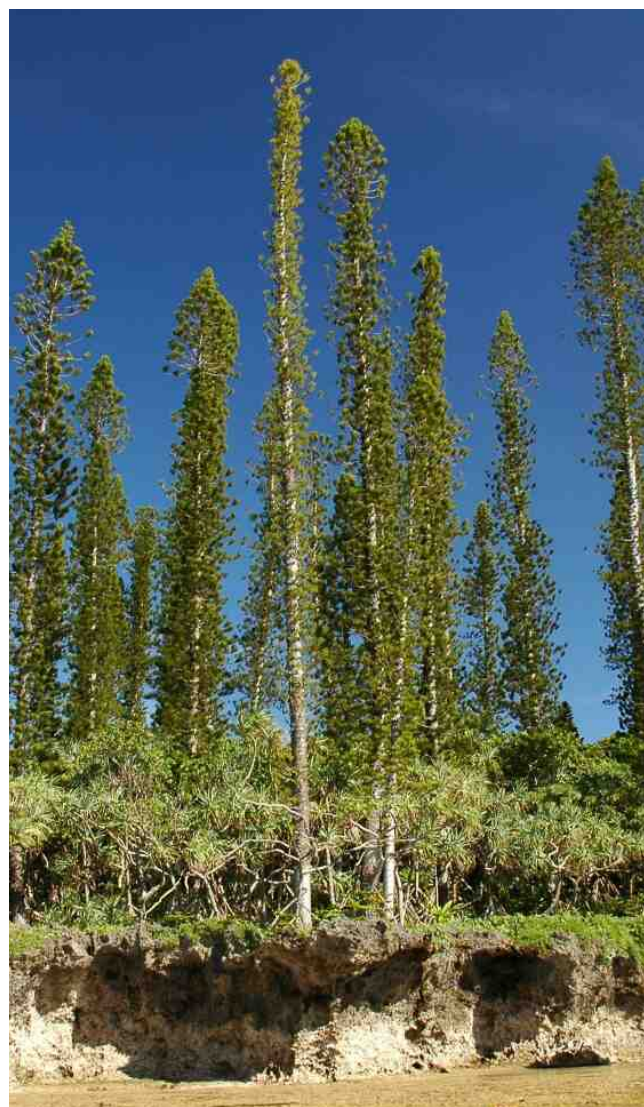
Pins colonnaires et pandanus sur la côte des environs de Yaté, Nouvelle-Calédonie

L'article 110-11 du Code de l'environnement de la province des îles Loyauté (CEPIL) précise que, « de manière formelle ou informelle, les autorités provinciales de leur propre initiative ou à la demande d'autorités coutumières et en concertation avec celles-ci, reconnaissent que les normes coutumières et les pratiques traditionnelles propres à un territoire donné, sous réserve de leur compatibilité avec les règles et politiques publiques de la province, s'appliquent pleinement lorsqu'elles permettent une protection optimale de l'environnement en conformité avec les valeurs culturelles locales. Dans ce cas, elles seront retranscrites dans la réglementation provinciale afin que leur non-respect puisse être sanctionné au même titre que les autres réglementations provinciales. Ce principe inspire le cas échéant la cogestion par la province et les autorités coutumières des écosystèmes naturels et notamment les aires protégées terrestres et marines. »