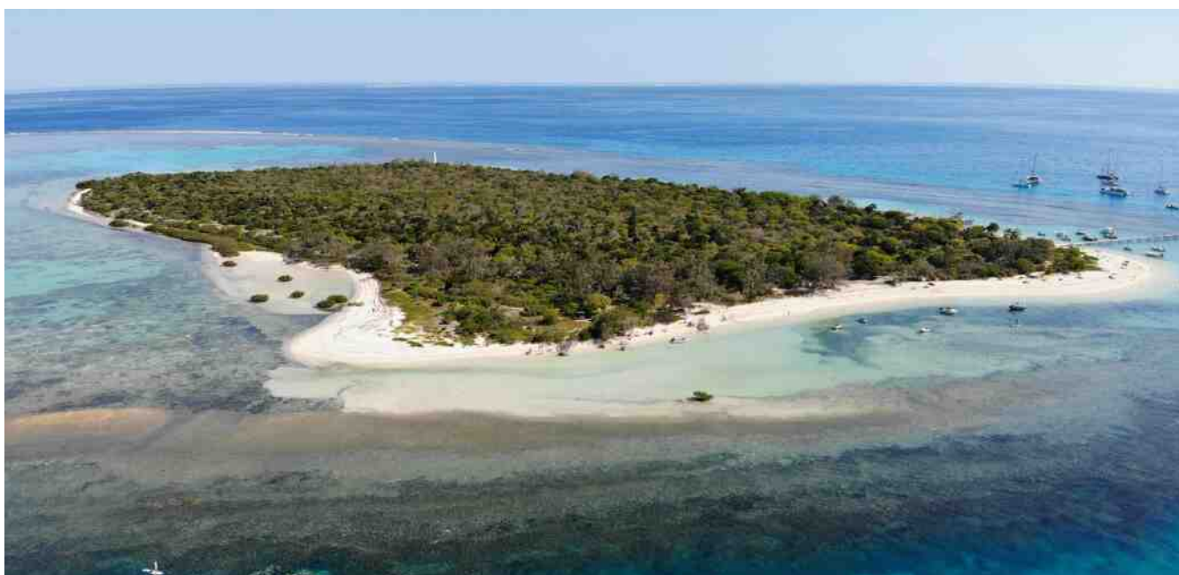
Vue du ciel de l'îlot Signal, Nouvelle-Calédonie