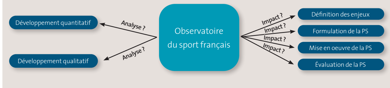
Doc. 1 – L'Observatoire du sport français : un outil d'impact et d'analyse des politiques sportives ?

●●● tives (7 fédérations, mais également le Comité national olympique et sportif français (CNOSF), 7 CROS et l'Association profession sport & loisirs Guadeloupe) ont vu le jour. L'objet de ces collaborations est ainsi de recueillir, traiter et analyser des données en fonction de problématiques exprimées par ces structures. Concrètement, sur la période 2021-2022, trois fédérations (handball, triathlon et montagne escalade) ont sollicité une analyse de la formation et de l'emploi au sein de leurs instances. Ces commandes font l'objet d'un travail hebdomadaire de recueil de données et d'allers-retours avec les techniciens ou les élus des fédérations. La réalisation de questionnaires validés par les dirigeants fédéraux et transmis à leurs structures déconcentrées, à leurs clubs ou encore à leurs pratiquants permet un recueil sincère des données, lesquelles sont ensuite traitées aux niveaux national et territorial. Enfin, un échange sur les préconisations ou axes d'amélioration