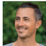
AUTEUR Arnaud Saurois TITRE Maître de conférences associé, université de Poitiers, Laboratoire MOVE (UR 20296)

La seconde nécessité pour transformer l'essai est de consolider un cadre d'analyse pour un meilleur « impact » et une meilleure robustesse dans la relation avec les organisations sportives. Ce cadre d'analyse, présenté brièvement ci-dessus, ne demandant qu'à être testé « en temps réel » pour ainsi être renforcé. Par conséquent, la valorisation scientifique des travaux de l'Observatoire est un enjeu important des prochains mois, tant cette démarche de recherche est spécifique par sa double approche quantitative et qualitative. Une collaboration avec l'INJEP (et son Observatoire territorial du sport et de la jeunesse) et avec le CNOSF, qui souhaite développer un Observatoire des pratiques fédérales, est actuellement en discussion. ■