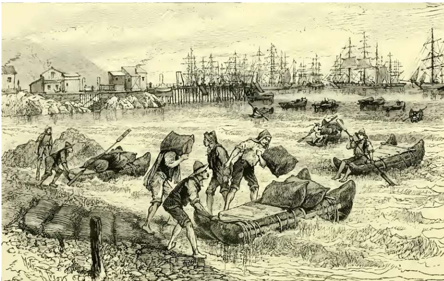
Figura 4. Escena de (des)carga de salitre en el puerto de Pisagua, 1890

Al desglosar en una ecuación los datos entregados por Russell y Humberstone, el esquema final del mecanismo se expresa de la siguiente manera: cada cargador movía 3000 quintales al día, lo que corresponde a unos 138 000 kilogramos 1 . Si los sacos contenían entre 300 y 310 libras, por lo tanto, entre 136 y 140 kilogramos 2 de salitre, cada cargador podía mover aproximadamente 1000 sacos diarios entre las bodegas y las balsas. Si eran cinco los cargadores que trabajan por cada balsa, significa que cada nave podía suministrar casi 5000 sacos a las lanchas y estas finalmente a las bodegas de los buques en una sola jornada. Cada balsa cargaba solo cinco sacos, un total de 63,5 kilogramos, y cada lanchón cargaba hasta 25 toneladas, es decir, unos 178 sacos, lo que equivale a unas 36 balsas de cuero de lobo marino. Si de esta manera se podían cargar 2000 toneladas de salitre en un día, esto implicaba la carga completa de unas 80 lanchas y otras 2880 balsas de cuero de lobo, para transportar en conjunto unos 14 240 sacos de nitrato gracias a un número idéntico de gestos de carga al hombro y al trote de los jornaleros en la playa.