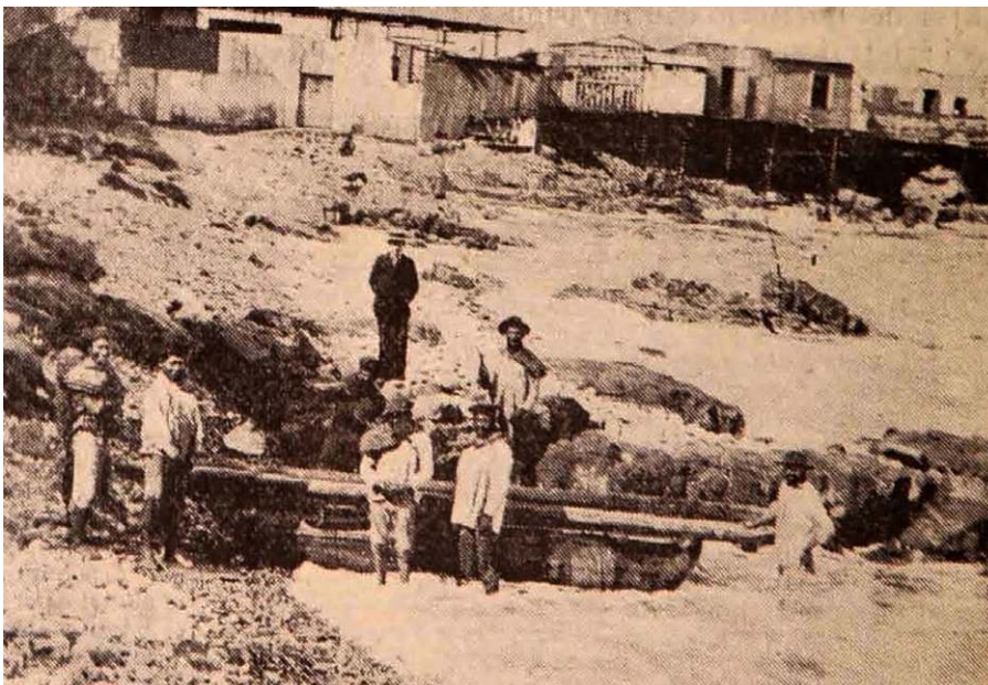
Figura 5. Balsa carbonera, Pisagua, 1902

Contados relatos hacen referencia además al servicio de las balsas en la descarga de insumos, mercancías y productos desde los veleros y buques anclados en las bahías hacia tierra firme. El mejor ejemplo, y seguramente el más ilustrativo de esta estrategia, es la lámina publicada por Rubén Rubó en la revista literaria Pluma y Lápiz del año 1902, donde se aprecia una balsa de cuero de lobo marino posada sobre la playa en la rada de Pisagua junto a siete personas, que por su vestimenta parecen ser seis trabajadores y un posible administrador, todos hombres (Figura 4). Encima de la tradicional embarcación hay instalados dos largueros de madera que exceden considerablemente su popa y proa para aumentar su capacidad de carga, una innovación técnica inédita. Aunque en la revista la información acerca de la embarcación y su utilización es nula, la breve leyenda de la imagen es del todo clarificadora acerca de su función y particular diseño: “Una balsa carbonera”.