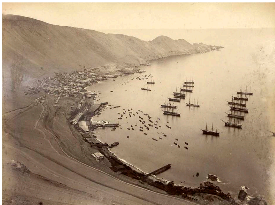
Figura 3. Vista panorámica y desde la altura de la bahía de Pisagua, circa 1892

aquí hay una balsa en la caleta, por decirlo así, su bahía. El botero está en el ripio y está estabilizando su embarcación. Acaba de pasar una ola hacia el mar. Cinco hombres, con el torso desnudo, y los pantalones enrollados sobre la rodilla, cada uno con un saco de salitre a la espalda, están listos corren uno tras otro, el botero salta sobre la balsa y toma su remo. La resaca lleva hacia afuera la balsa, y flotando livianamente sobre el oleaje es diestramente dirigida por su botero, u hombre de balsa, hasta que llega al lado de la lancha. Se carga a la lancha y la tripulación la lleva al costado del barco, donde la carga se traspasa a la bodega del buque con tanta rapidez, que veinticinco toneladas de salitre, la carga que acostumbran a llevar las grandes lanchas, se sube a cubierta en menos de media hora. Debe tenerse gran cuidado al colocar el salitre en la plataforma de la balsa, colocarlo en la lancha y llevarlo al barco, porque el hecho de que se moje el salitre representa una fuerte pérdida [...] un hombre fuerte puede estibar 3000 quintales al día [...] Desde la mañana temprano trabajan durante unas cuatro horas llevando sacos de salitre que pesan de 300 a 310 libras, enseguida se sirven una comida —abundante— de porotos. A las doce comienzan nuevamente. Después de tres horas terminan su trabajo, y a las seis horas y media que trabajan es todo lo que pueden hacer al día”. [Russell, 2011(1890), p. 184-185]