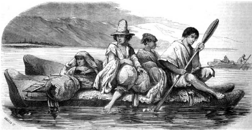
Les balsas. — D'après les dessins de M. Max. Radiguet

“... la operación de desembarcar en esa costa es a la vez difícil y peligrosa, especialmente con la luna llena y cambiante, cuando la marea está alta; una acotación que aplica para toda esta costa. Me habían dicho que los barcos rara vez lograban cruzar las olas, y que la balsa, o canoa doble de este país, era lo apropiado para usar; hice el experimento, no obstante, en mi barco, que como consecuencia se hundió, lo que me generó gran pesar. La balsa, que usamos desde ahí en adelante, está hecha de dos pieles de foca infladas, colocadas una al lado de la otra y conectadas por piezas transversales de madera, y fuertes amarras de cuero; sobre eso una plataforma de esteras de caña forma una suerte de plataforma, de cerca de cuatro pies de ancho, y seis u ocho pies de largo [...] La flotabilidad de estas balsas les permite cruzar fácilmente y de forma segura las olas, y sin mojar a sus pasajeros, en casos en que un bote ordinario se habría inevitablemente hundido. Todos los bienes que van hacia el interior, en esta parte de la costa, se desembarcan de esta manera. Las grandes barras de plata y los sacos de dólares también, las que son enviadas a cambio de las mercancías desembarcadas, pasan a través de las olas en estas embarcaciones auxiliares, asegurando un transporte seguro” [Hall, 1827, p. 173; la traducción es mía].