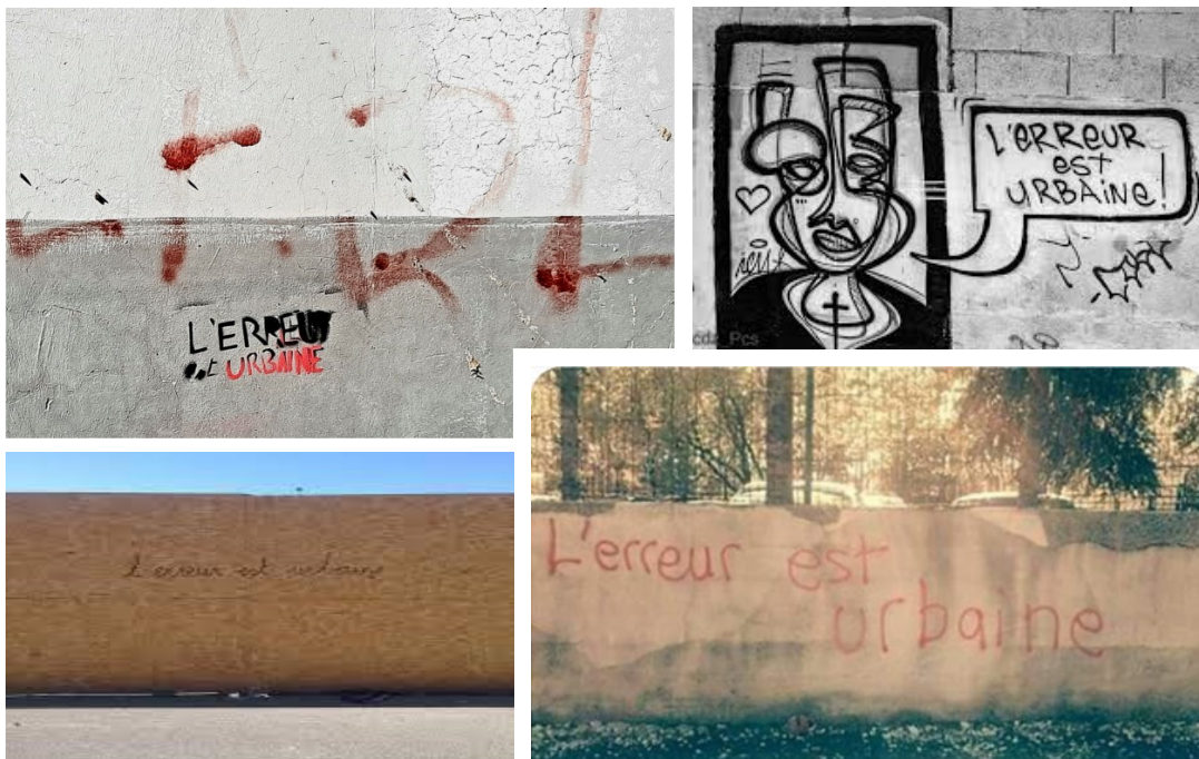
1. Un slogan toujours plus présent sur les murs des villes

Le projet de numéro a commencé comme une boutade et un contrechamp. La boutade, c'est celle de ce détournement étonnant et efficace de la formule cartésienne, observé une première fois sur les graffitis d'un mur lors du mouvement des Gilets Jaunes, et qu'on voit, depuis, régulièrement, peupler les murs de villes françaises : « l'erreur est urbaine » (image 1). La formule a résonné comme un appel à un contrechamp. Depuis dix ans, la revue Urbanités explore en effet différentes facettes de l'urbain, et a longtemps mis en exergue sur son site une citation qui lui sert de mantra, tirée du quasi-poème urbain Espèces d'espaces de Georges Perec, qui affirme : « Nous ne pourrions jamais expliquer ou justifier la ville. La ville est là. Elle est notre espace et nous n'en avons pas d'autre. Nous sommes nés dans des villes. Nous avons grandi dans des villes. C'est dans des villes que nous respirons. ». Pour ce numéro anniversaire, l'idée a émergé de renverser la perspective, et d'interroger différemment les dysfonctionnements et défaillances de ce qui est l'objet au cœur de la revue, l'urbain, en interrogeant jusqu'à la pertinence de l'urbain lui-même.