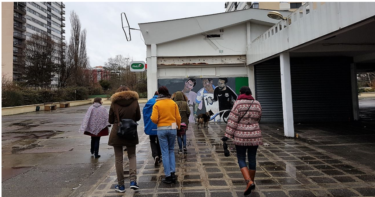
2. À la recherche d'erreurs urbaines – marche exploratoire à Fontenay-sous-Bois

La transformation des espaces publics et de la voirie sont ainsi un terrain de jeu pour des réajustements, afin d'en lisser les aspérités, voire le caractère insécurisant par la mise en place de dispositifs variés, qu'il s'agisse d'éléments de signalisation, de transformations matérielles des surfaces pour les rendre plus accessibles. C'est ce qu'a démontré historiquement le déploiement de procédures du type marches exploratoires (image 2), afin de saisir les difficultés auxquelles faisaient face les utilisatrices et utilisateurs variés de l'espace public et d'y apporter, par des aménagements (mobiliers urbains, type de matériaux, formes urbaines) des formes de correction pour en faire un espace plus accueillant pour tout type d'humains, voire de non-humains.