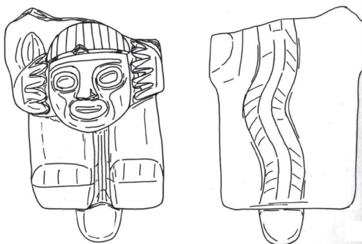
Figura 5. Estatua antropomorfa con un Suche en la espalda. Museo Lítico de Pukara. Dibujo propio.

dos. Los tableros y sus disposiciones pueden ser rigurosamente idénticos en los dos lados opuestos de la estela, o en orden inverso. Se encuentran numerosos motivos frecuentes en la iconografía de las esculturas Pukara. Se ven figuraciones de batracios, formas geométricas en anillos, escaleras o zigzags, cruces de cuadros, criaturas bicéfalas y otras criaturas zoomorfas compuestas simplificadas, siempre según las reglas expresadas precedentemente. Así, se nota continuamente los mismos rasgos estilísticos comunes, a pesar de una organización en tableros mucho más geométrica.