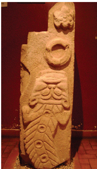
Figura 4. Estela del Suche, Pukara. Museo Lítico de Pukara