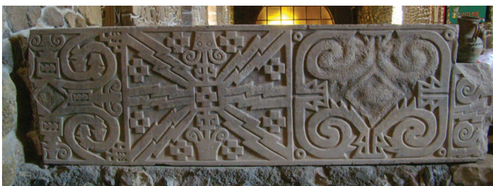
Figura 6. Estela de Arapa, utilizada ahora como altar en la iglesia de Arapa.

La fortaleza del estudio sobre las esculturas radica en que se conocen numerosos ejemplos que vienen de diferentes sitios de la cuenca del lago Titicaca. Eso nos permite tener un abanico bien completo, y de poder generalizar los elementos nombrados.