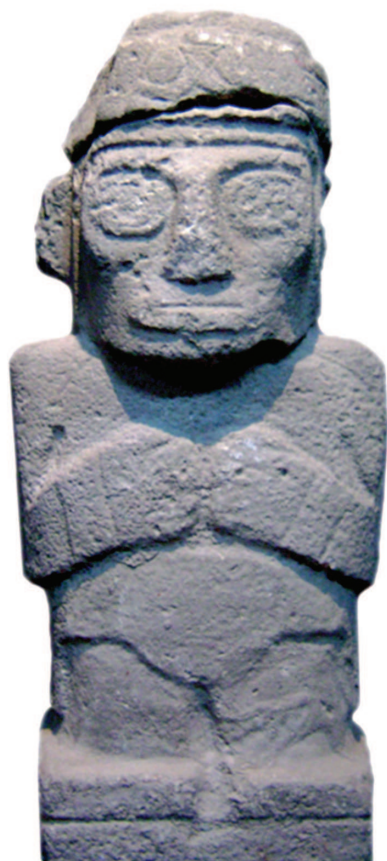
Figura 1. Estatua Pukara. Museo Lítico Pukara

vertical, y los pies acaban en dedos rectangulares separados por incisiones. Contrariamente a las figuras de las cerámicas, las estatuas antropomorfas tienen generalmente cinco dedos en las manos y en los pies. Se encuentran de la misma manera los ornamentos de puños y de tobillos. El torso puede estar desnudo o con un ornamento de cuello. Además, puede, como los brazos, servir de soporte a imágenes geométricas o figuras zoomorfas simplificadas. Estos elementos son los mismos que se ven en todos los motivos antropomorfos de la cerámica Pukara. La cabeza trofeo cargada por el personaje está trabajada en alto relieve, desnuda, representada mucho más pequeña que la del personaje, con incisiones representando la cabellera, y sin orejas u ornamentos. Pensamos que eso fortalece la noción de inferioridad de la cabeza trofeo en comparación al personaje principal.