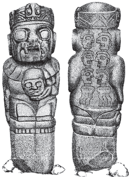
Figura 3. El Hatun Nakaq de Pukara. Revista del Museo Nacional , Vol. 1 N° 1, Valcarcel (1932: 18-35).

permite una afiliación casi directa con la iconografía de la cerámica Pukara. La representación del personaje en su globalidad, y los detalles, tienen muchos rasgos en común con las figuras antropomorfas de las cerámicas Pukara.