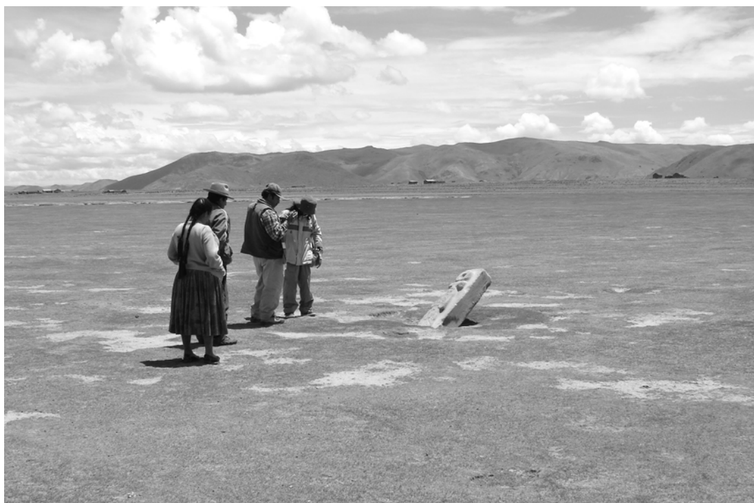
Figura 3. Vista del interior de la laguna seca María Huancane Qocha. A primera vista sobresale la litoescultura. Vista inside the dry lagoon María Huancane Qocha. At first sight stands the stone sculpture.