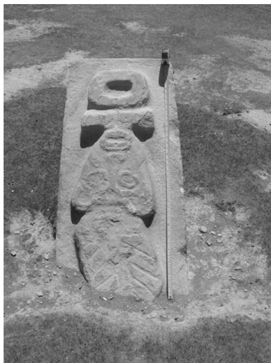
Figura 4. La piedra esculpida de estilo Suche de la sociedad Pukara. The sculpted stone Suche style of Pukara society.

Las versiones que luego recogimos, en el 2009, alimentaron mejor el mito. La versión de la Sra.