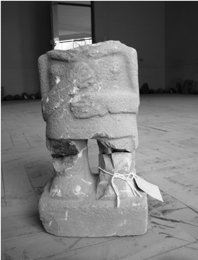
Figura 5. Escultura antropomorfa femenina Pukara encontrada en la plaza de Arapa. Female anthropomorphic sculpture Pukara found in the square of Arapa.