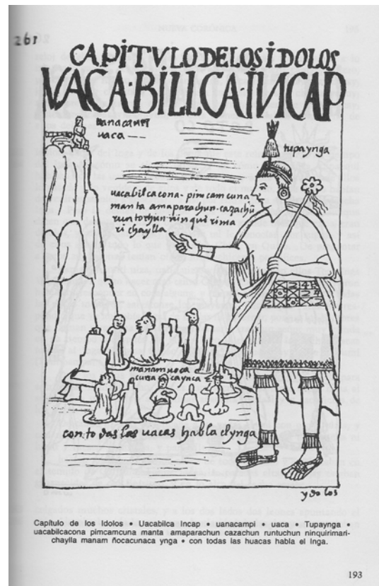
Figura 2. Imagen de Guamán Poma (2005:193 [1615:261]) que representa a las huacas como piedras, hablando con el Inca. Image of Guaman Poma (2005:193 [1615:261]) representing the huacas as stones, talking to the Inca.

Todos esos indicios nos indican la importancia de las esculturas en los tiempos prehispánicos, no como elementos de ornamentación, sino relacionados con los mitos fundadores de una sociedad. Aparecen como huacas sagradas ancladas a un espacio y tiempo, que conmemoran una historia.