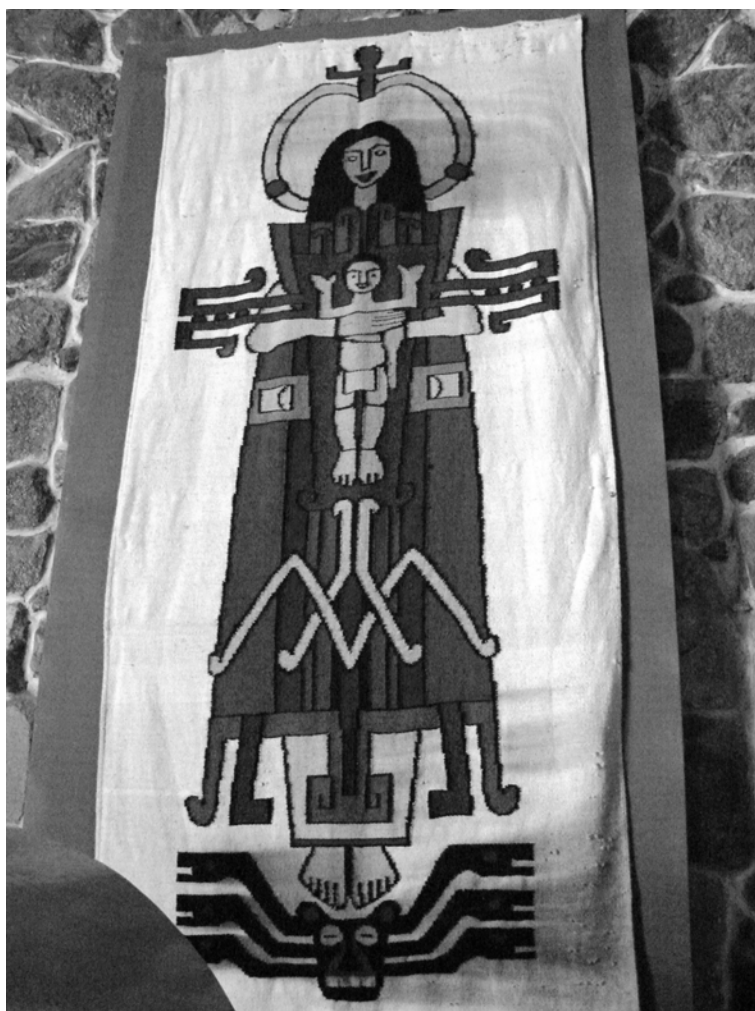
Figura 6. Imagen de la Virgen María, representada sobre un manto, en la iglesia de Arapa. Image of the Virgin Mary displayed on a mantle, in the church of Arapa.

2008). En la misma región, en Arapa, los pobladores han representado a la Virgen María como una huaca ataviada con iconografía Pukara (Figura 6).