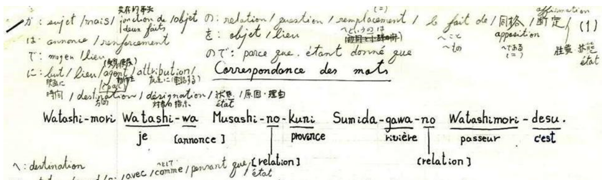
III. 6 : Notes manuscrites extraites des carnets du compositeur lors de son travail de transcription pour faciliter l'apprentissage des rôles et mélodies des chanteurs.

Ces différentes strates d'écriture du texte, qui possèdent toutes une visée didactique, révèlent l'importance que le compositeur attache à la transmission de ses émotions, à la création d'émotions pour chacun de ses interlocuteurs, qu'il soit artiste ou auditeur. A travers ces transcriptions successives, qui résultent des activités du compositeur, c'est le réel de l'émotion qui est transformé en émotion réalisée. C'est une forme d'épistémologie des émotions qui résulte du travail de transposition didactique effectué par le compositeur.