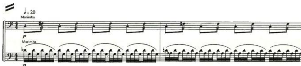
Ill. 4 : Bribes de l'ouverture de l'opéra.

On retrouve dans cette écriture de l'ouverture de l'opéra l'ensemble des notes de la mélodie que le compositeur travaille tant au niveau des hauteurs que des rythmes. Cela crée une tension progressive qui se résout sur la première note prononcée a cappella par l'un des chanteurs. Sous l'apparente stabilité rythmique des mesures qui s'enchaînent, on perçoit une tension émotionnelle due aux jeux de rapports entre les intervalles et leur progression par chromatismes. Cet artifice de tension est le fruit de l'activité créative et exprime l'émotion réalisée du compositeur. Ces transformations progressives des éléments musicaux sont autant de transpositions didactiques qui indiquent le rapport évolutif du musicien aux hauteurs, aux durées, aux intensités des sons.