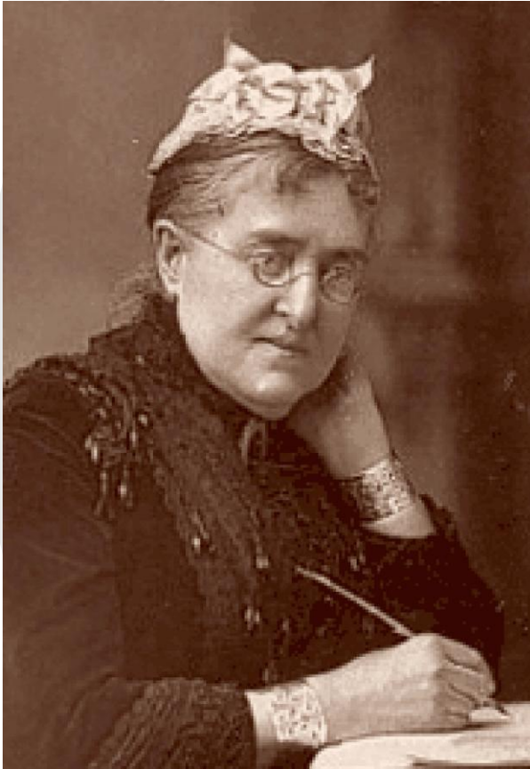
Eliza Lynn Linton, 1822-1898