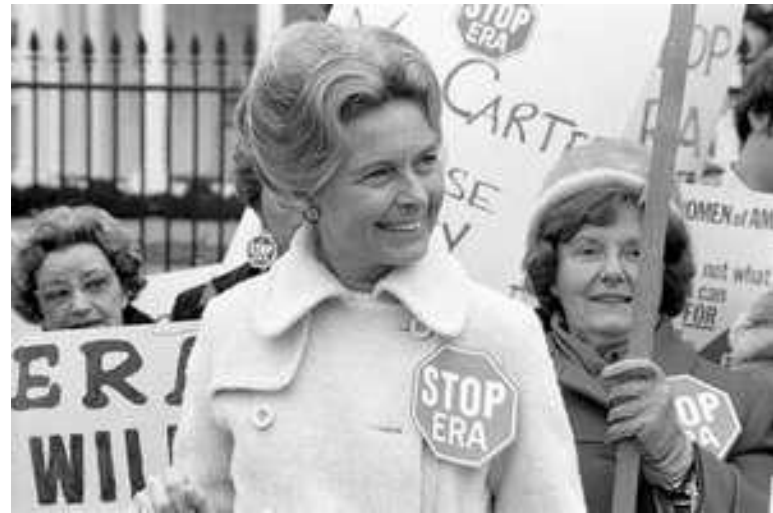
Phyllis Schlafley, 1924-2016