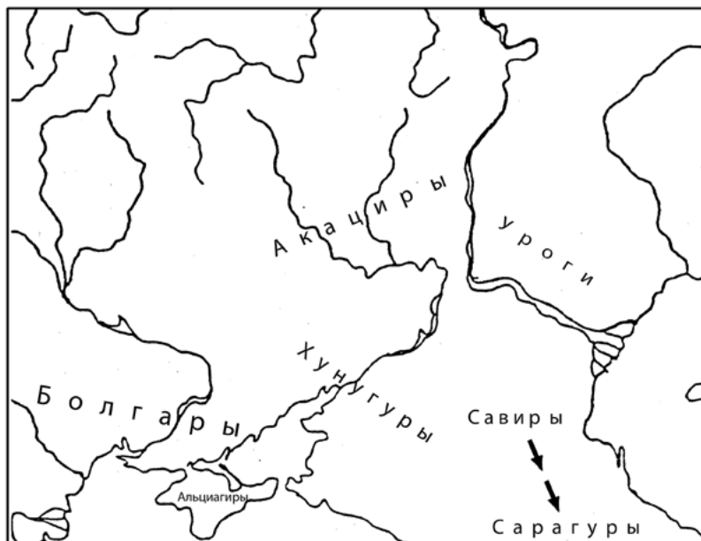
Рис 1. Карта расселения степных кочевников постгуннского времени по Иордану (480-527 гг.). По: Казанский, 2016.

SC I - Латышев В.В. Scythica et Caucasia. Известия древних писателей греческих и латинских о Скифии и Кавказе. Том I. Греческие писатели. Санкт-Петербург, 1890.