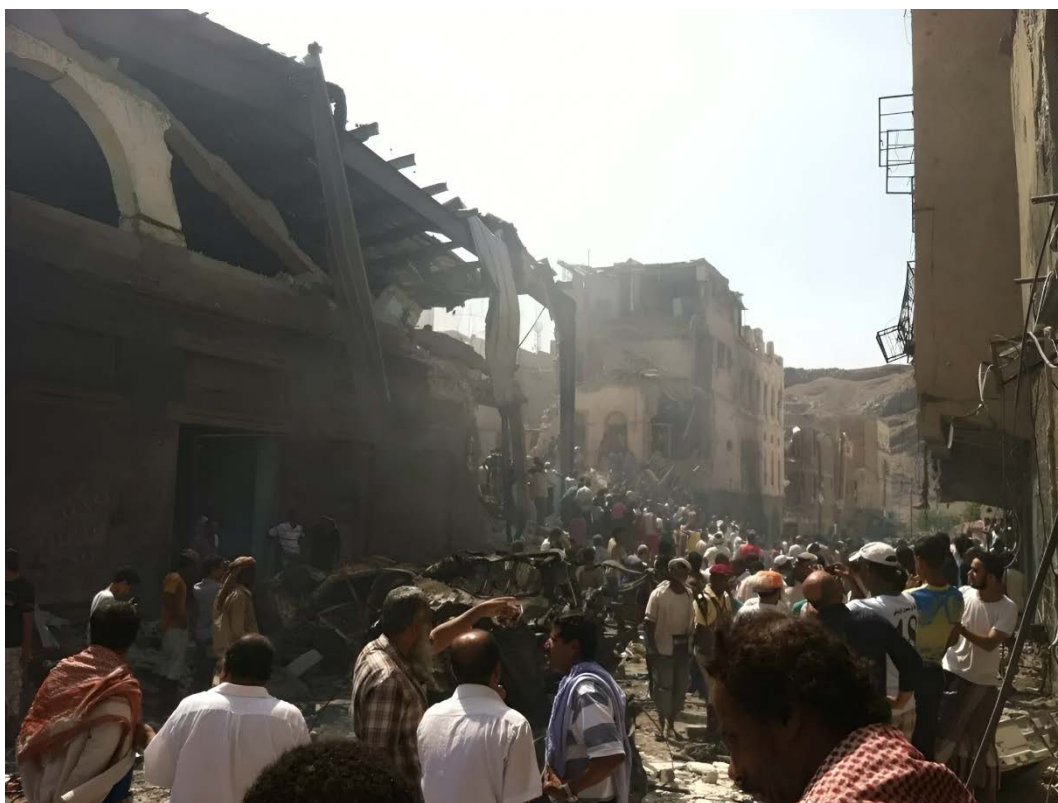
Ill. 7. Branche des Archives nationales à Aden (2015).