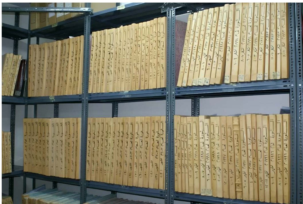
Ill. 6. Les archives de presse conservées au CNA.