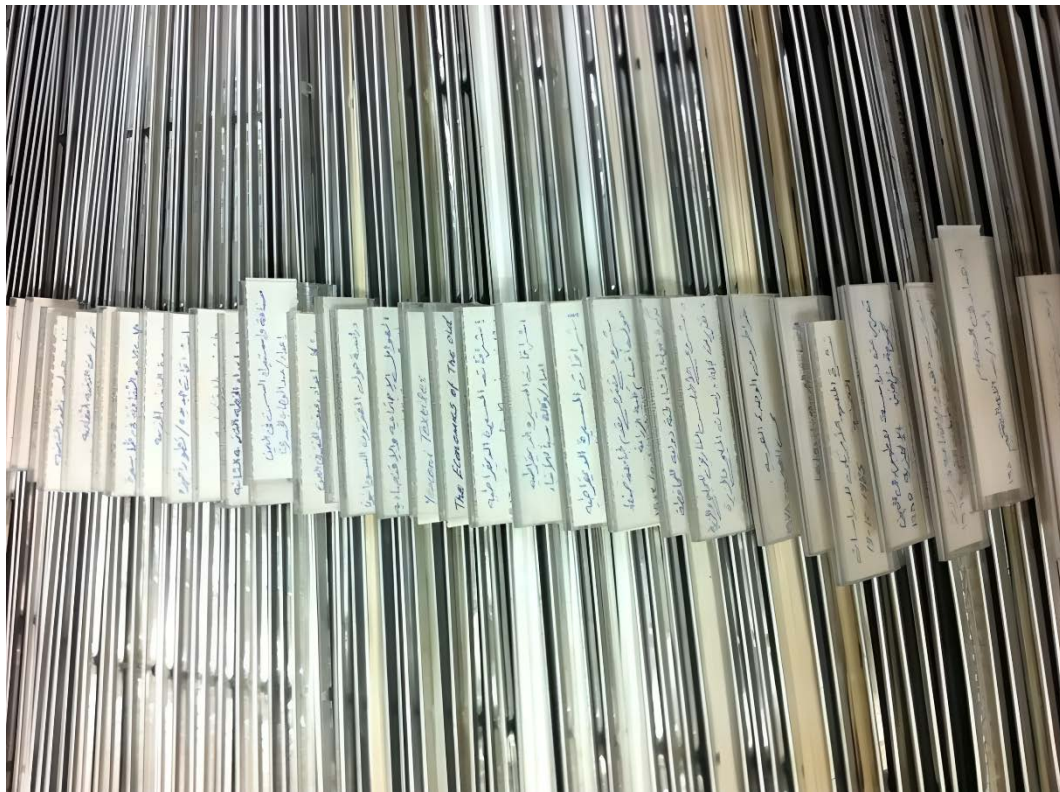
Ill. 1. Les archives organisées au CYER en 2013.

En revanche, il est très difficile d'évaluer le volume des documents de personnes privées conservés au CYER. Ces documents peuvent être des lettres et des télégrammes échangés entre le commandement général et les gouvernorats, des photographies, des manuscrits et des ouvrages rares sur les révolutions du 26 septembre 1962 et du 14 octobre 1963, ainsi que sur le siège de Sanaa en 1967.