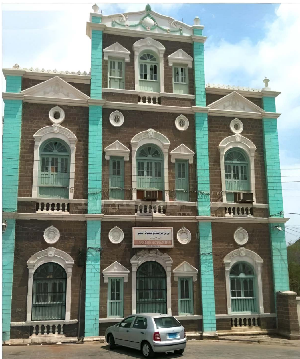
Ill. 2. Le bâtiment de la Branche du CYER à Aden en 2015.