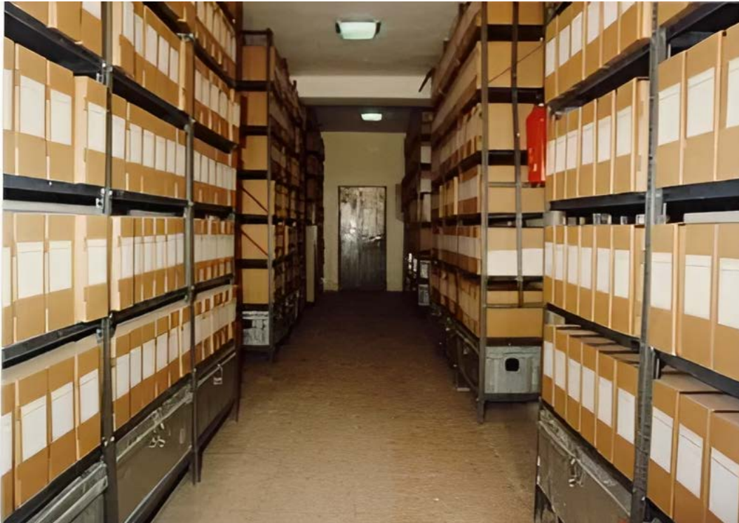
Ill. 5. Les Archives conservées au CNA après traitement.