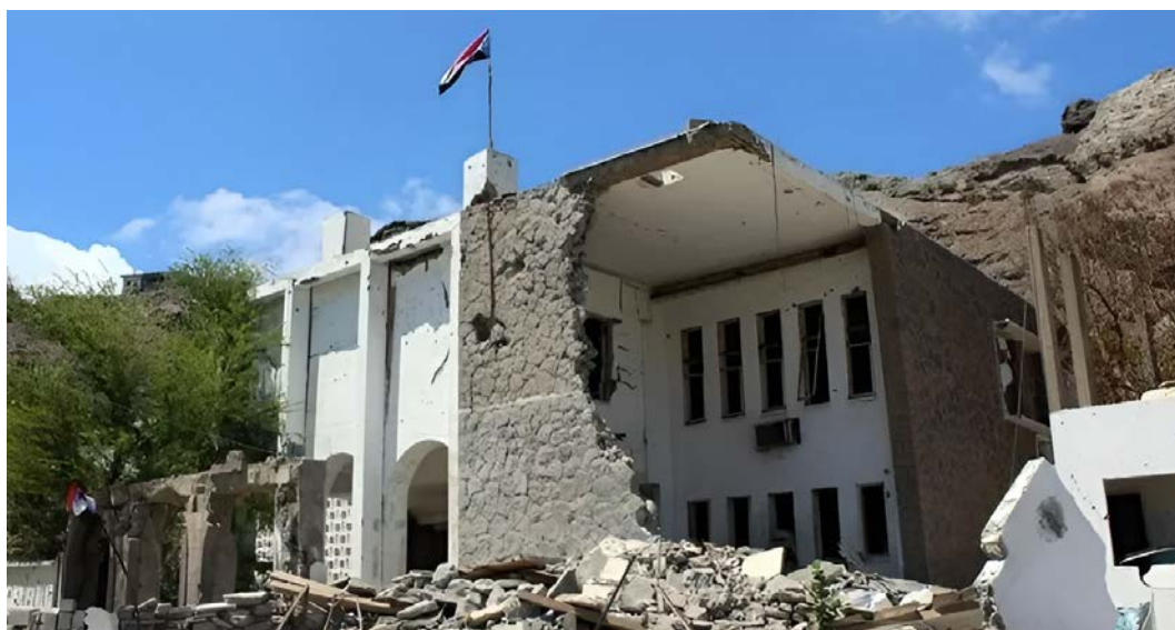
Ill. 9. Destruction de la Cour d'appel.

La Cour d'appel est aujourd'hui complètement détruite à cause du conflit civil et des bombardements de la coalition arabe qui l'ont frappée en 2015. Le Président de la Cour a estimé que 40 % des archives judiciaires et d'authentification ont été brûlées ou pillées 96 .