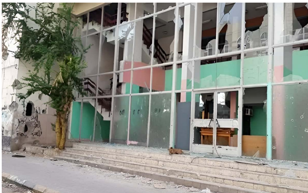
Ill. 8. Bibliothèque nationale d'Aden (2015).

En 2016, les Émirats arabes unis ont financé à eux seuls les travaux de la réparation intégrale de la bibliothèque d'Aden. Une fois remise en état, elle n'a pas pu ouvrir ses portes au public. Car les locaux ont été occupés par des hommes qui prétendaient l'avoir protégée et réclamaient leur salaire. Mécontents, ils ont emporté le matériel neuf : les chaises, les tables et les climatiseurs.