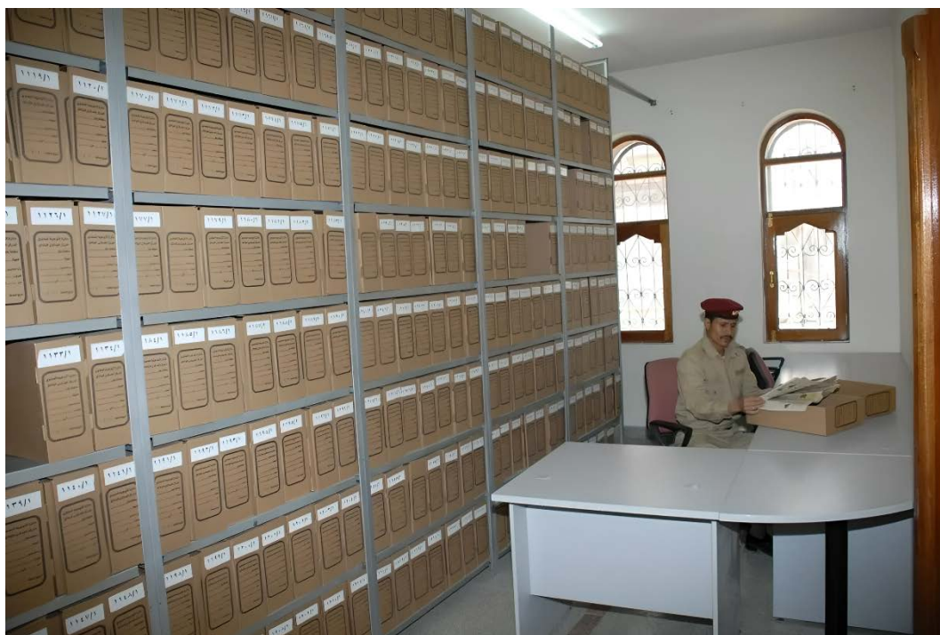
Ill. 10. Les Archives conservées au CAM après traitement.

La Direction de l'encadrement moral a aussi attribué des magasins dans d'autres de ses bâtiments pour conserver les archives du CAM avant leur versement. La plupart des archives sont en vrac dans des malles métalliques, sacs de jute, caisses de bois et dans deux conteneurs. Le CAM a estimé que le total des archives conservées est de plus de quarante kilomètres linéaires (kml).