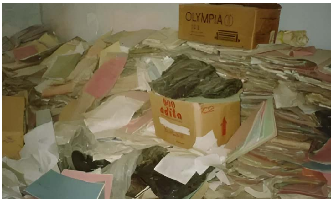
Ill. 4. Les archives avant versement au CNA.