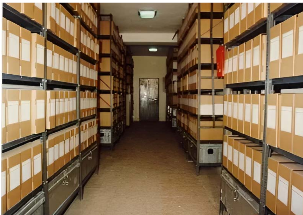
Ill. 5. Les Archives conservées au CNA après traitement.