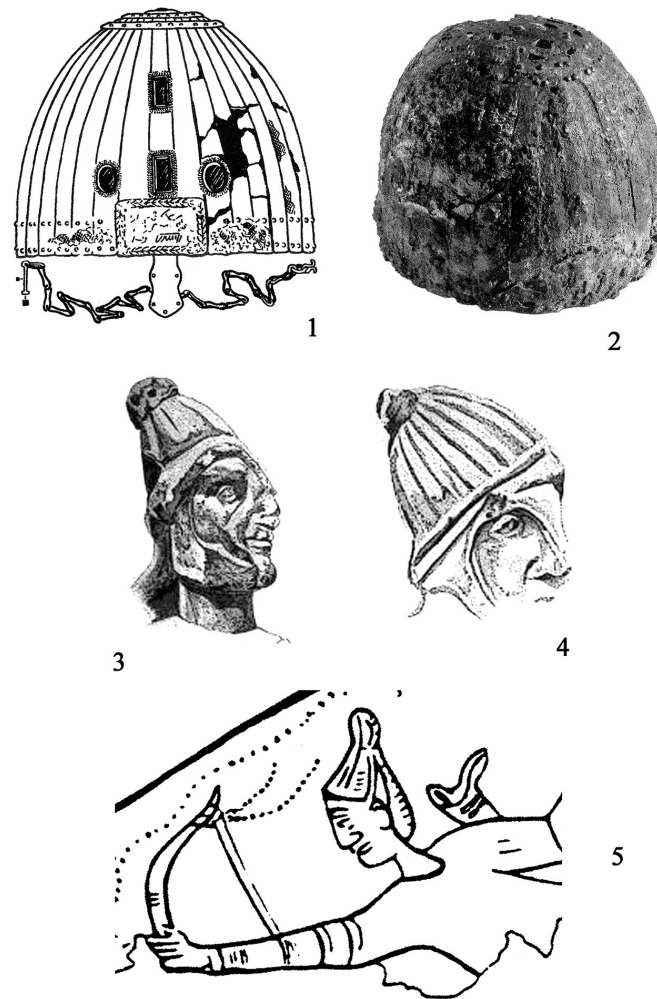
Рис. 2. Ламеллярные шлемы римского времени и их изображения. 1: Кишпек, погр. 13; 2: Минеральные Воды; 3,4: Фессалоники, арка Галерия, 298 г.; 5: Аден, Музей, часть изображения на металлическом блюде. По: 1: Бетрозов, 1987. Рис. III, 1; 2: Симоненко, 2014. Рис. 18, 3; 3,4: Kubik, 2017a. Fig. 6; 5: Kazanski, 1003. Pl. 25, 70.