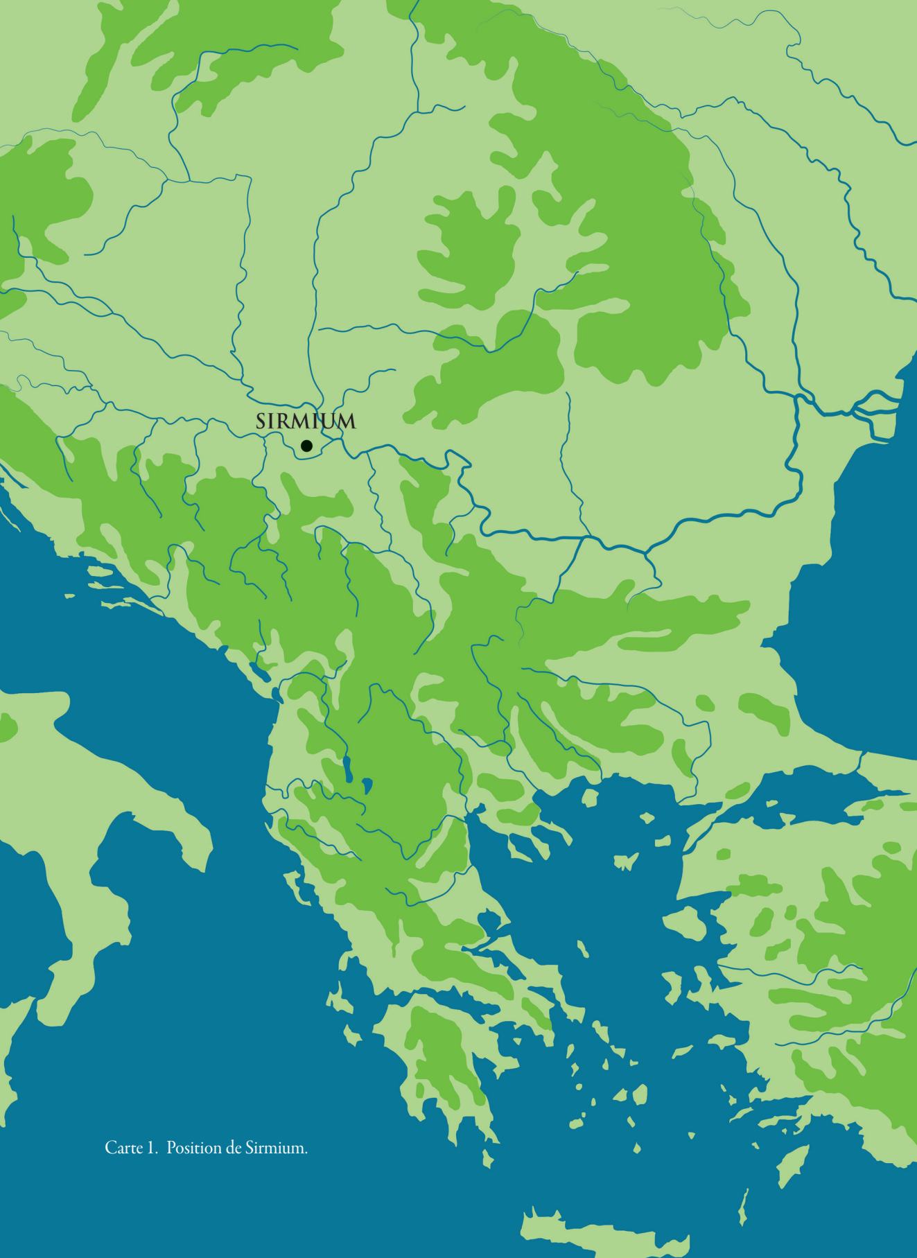
Carte 1. Position de Sirmium.