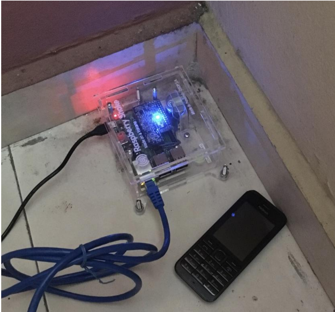
Figure 1 - Photo d'un sismomètre Raspberry Shake, installé chez un hébergeur à Port-au-Prince. Le téléphone portable donne l'échelle.

De faible encombrement (environ 10 x 10 x 5 centimètres), les RS présentent l'avantage d'être peu coûteux (entre 500 et 900 USD contre 10 000 à 30 000 USD pour un sismomètre conventionnel) et de nécessiter que très peu de maintenance. L'installation et l'opérationnalisation des RS nécessite uniquement un raccordement électrique et une connexion internet pour envoyer leurs données vers un serveur informatique qui les archive et en déduit les caractéristiques des séismes enregistrés, notamment leur localisation, profondeur et magnitude. Ils peuvent ainsi être déployés chez des particuliers ou auprès d'institutions qui disposent de cette logistique de base. En plus d'enregistrer les séismes, les RS peuvent alors devenir un lien entre citoyens et scientifiques, et permettre leur dialogue. On les place au rez-de-chaussée dans un endroit le plus calme et le moins passant possible de manière à optimiser leur capacité de détection des séismes. De fait, les RS se fondent dans