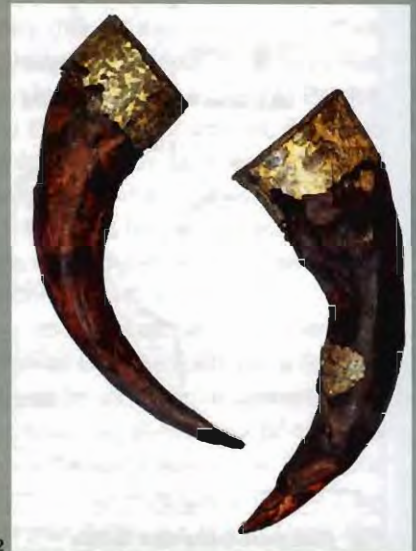
1. Planche tirée d'un ouvrage de 1949 consacrée à la tombe «princièra» de Tchernaia Mogila à Tchernigov, en Russie, datée de la seconde moitié du X e siècle. 1 et 2: reconstitution du tumulus et de la chambre funéraire placée au-dessous; 3 à 6: épée, casque et cornes à boire mis au jour dans la tombe.