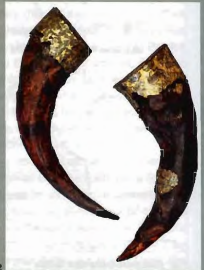
1. Planche tirée d'un ouvrage de 1949 consacrée à la tombe «princière» de Tchernaia Mogila à Tchernigov, en Russie, datée de la seconde moitié du X e siècle. 1 et 2: reconstitution du tumulus et de la chambre funéraire placée au-dessous; 3 à 6: épée, casque et cornes à boire mis au jour dans la tombe.