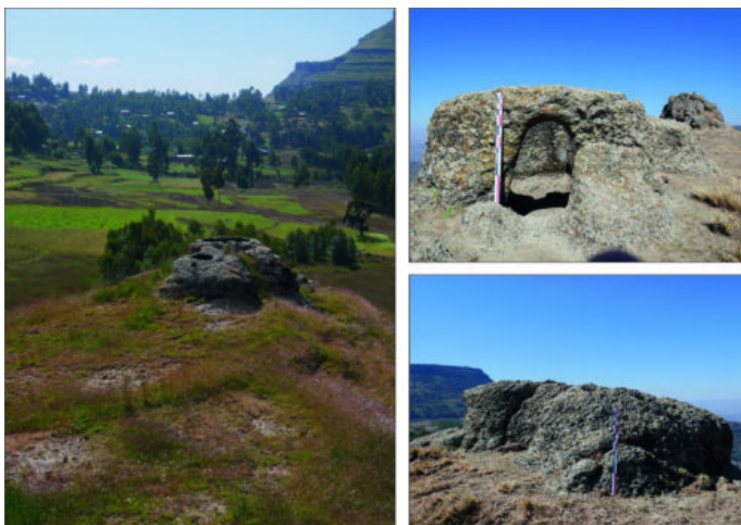
Fig. 4. Le site de Qulta et son environnement (clichés M.

Il ne s'agit pas d'une cavité à proprement parler mais plutôt d'un aménagement rupestre à l'image du site de Qulta sur le même plateau (Fig. 2 et 4). Creusée dans un piton rocheux d'ignimbrite, au nord-est de l'église d'Aṣatan Māryām, la structure prend la forme d'un boyau long de 1,93 m (Fig. 5). Sa longueur diminue en fonction de la progression vers l'intérieur, passant de 0,83 m à 0,35 m. Sa hauteur diminue également de la même manière, passant de 0,98 m à 0,68 m. L'accès au boyau n'est pas spécifiquement aménagé, prenant la forme d'un simple percement dans le mur. Dès lors, sa fonction reste à déterminer.