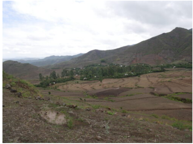
Fig. 7. Vue générale de l'environnement de la vallée de Medage.

Dans les environs de l'église rupestre de Bilbālā Qirqos, à une vingtaine de kilomètres au nord-ouest de Lalibela, se trouve une petite butte qui domine de quelques mètres le paysage environnant. À son sommet, trois blocs taillés de forme rectangulaire, ont été découverts. Ils sont en position secondaire. Quelques cupules sont visibles sur plusieurs faces. Enfin, directement à proximité des blocs et en contrebas de la butte, dans une parcelle en culture, des tessons de céramique sont visibles en surface. Les auteurs du XX e siècle, qui ont effectué des missions de reconnaissance dans les environs (Monti della Corte, 1940 ; Miquel, 1959), ne mentionnent pas l'existence de vestiges. Si la morphologie de cette butte semble anthropique, seuls des sondages peuvent venir apporter des éléments de réponse. Il n'est pas possible, pour le moment, de rattacher ces blocs à leur fonction d'origine.