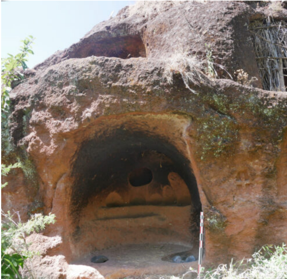
Fig. 1. La cavité de Gannata Māryām (vue depuis l'est).

Les recherches ont été organisées en fonction du dépouillement de la faible bibliographie disponible et de l'étude cartographique de la zone ciblant de potentielles zones à inspecter. Des enquêtes orales auprès des locaux – essentiellement des fermiers – ont également été indispensables pour bénéficier de leur connaissance des lieux et de l'environnement. Les sites ont été localisés par GPS, photographiés et relevés par le biais de descriptions et de croquis. Enfin les recherches dans les fonds de vallées et les hauts plateaux – aussi appelés ambas – ont permis de se rendre compte de l'évolution du paysage et d'évaluer le potentiel archéologique de certaines zones.