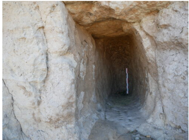
Fig. 5. Le site de Dega Wāṣā (vue depuis l'ouest)

6). Un premier couloir de 4,30 m de long dessert la première salle de forme grossièrement ovale d'un peu plus de 11 m 2 avec une hauteur de plafond de 2,21 m. Un aménagement de type alcôve (0,67 m x 1,84 m) est visible dans la paroi sud-est avec un ressaut large de 0,38 m. L'accès à la seconde salle se fait après avoir traversé le second couloir de 1,50 m de long. Ce nouvel espace, de forme rectangulaire possède des dimensions un peu plus importantes (13 m 2 ), avec une hauteur de plafond quasiment équivalente (2,14 m). Le même type d'alcôve est présent dans la paroi est (0,79 m x 1,76 m). Un autre creusement, cette fois dans le sol, compose les aménagements de cet espace. D'après Mengistu Abebe, des ossements humains auraient été trouvés, associés au creusement ; renvoyant d'après lui à une tombe (Mengistu 2010 : 107). L'aspect général semble plus travaillé avec des tentatives d'angles droits au niveau du deuxième couloir. Les observations des traces d'outils permettent de reconnaître l'emploi de deux outils différents (un pic et un ciseau). Ces derniers renvoient à deux actions de creusement, une première de dégrossissement et une seconde de lissage des parois. Dans le cas présent, l'étape de lissage apparaît comme grossière (Wootton et al. , 2013 ; Bessac, 1986).