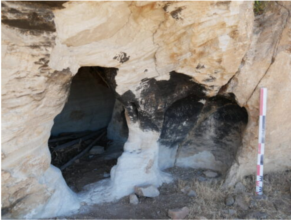
Fig. 3. Vue générale de la cavité à proximité d'Aṣatan Māryām (vue depuis le sud-ouest).