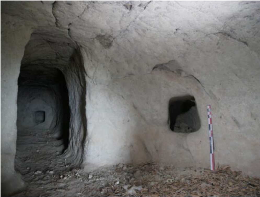
Fig. 6. La cavité de Chelema Wāsā, salle 1 (vue depuis le nord-ouest).

Dès lors, qu'en est-il de la fonction de ce site ? La mention d'ossements humains par Mengistu Abebe et la présence de deux alcôves, similaires aux tombes aménagées dans les parois des cours des églises de Lalibela, pourrait renvoyer à une fonction funéraire (Derat et Gleize, 2015 : 165, note 16).