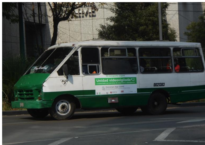
Figure 7.3. Autocollant qui met en avant la modernité "unité sous vidéosurveillance connectée" sur un bus des années 90, Tanikawa K, Mexico 2020.

réalité au service d'un projet plus vaste qui vise à réaffirmer la mainmise des pouvoirs publics sur le transport et à favoriser la formalisation du secteur artisanal par son inclusion dans un système de transport métropolitain. La production et l'exploitation de données y joue évidemment un rôle important, mais à Mexico et plus encore à Accra et à Dakar, le numérique est avant tout un instrument d'habillage et de valorisation des politiques sectorielles (Figure 7.3.), mobilisé pour renouveler l'image du transport en proposant une information plus riche aux voyageurs, des modes de paiement dématérialisés.