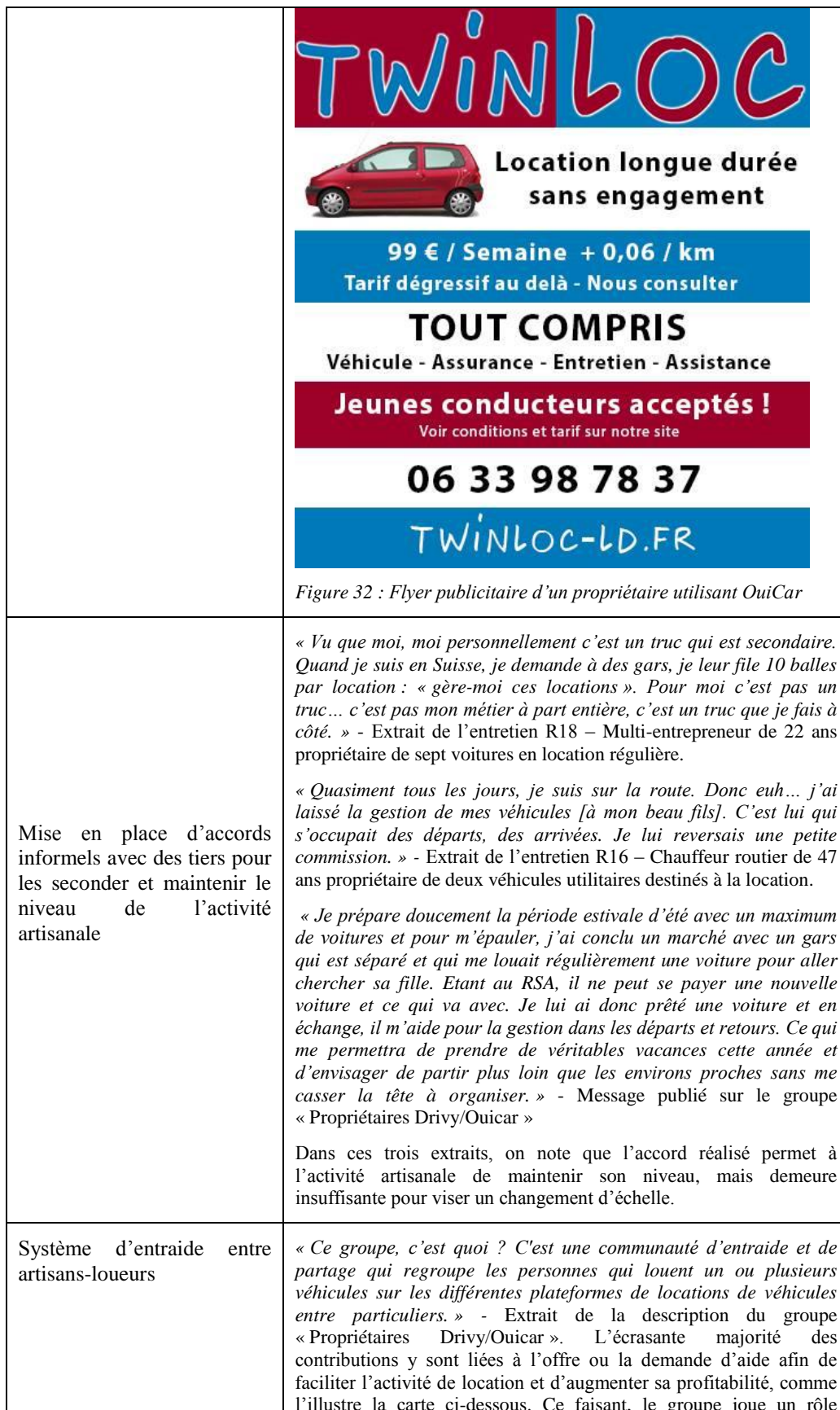
Figure 32 : Flyer publicitaire d'un propriétaire utilisant OuiCar