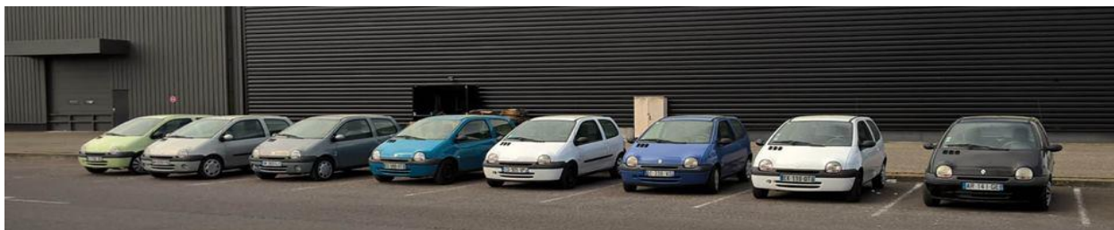
Figure 1 : Un « artisan-loueur » utilise le parking d'un supermarché pour stocker ses véhicules (photographie publiée sur le groupe « Propriétaires Drivy/Ouicar »)

d'épargner leur sphère personnelle, il leur arrive de mettre en place des dispositifs bureaucratiques ad hoc qui viennent s'ajouter à ceux imposés par la plateforme : « Je me rends disponible de 7h à 22h, sur rendez-vous. En dehors de ces horaires, c'est à la demande. Suivant la façon dont le locataire demande, je le fais gratuitement ou alors c'est 50 € (ce qui génère aussitôt un refus) » (R17, gestionnaire d'une flotte d'une trentaine de véhicules sur OuiCar).