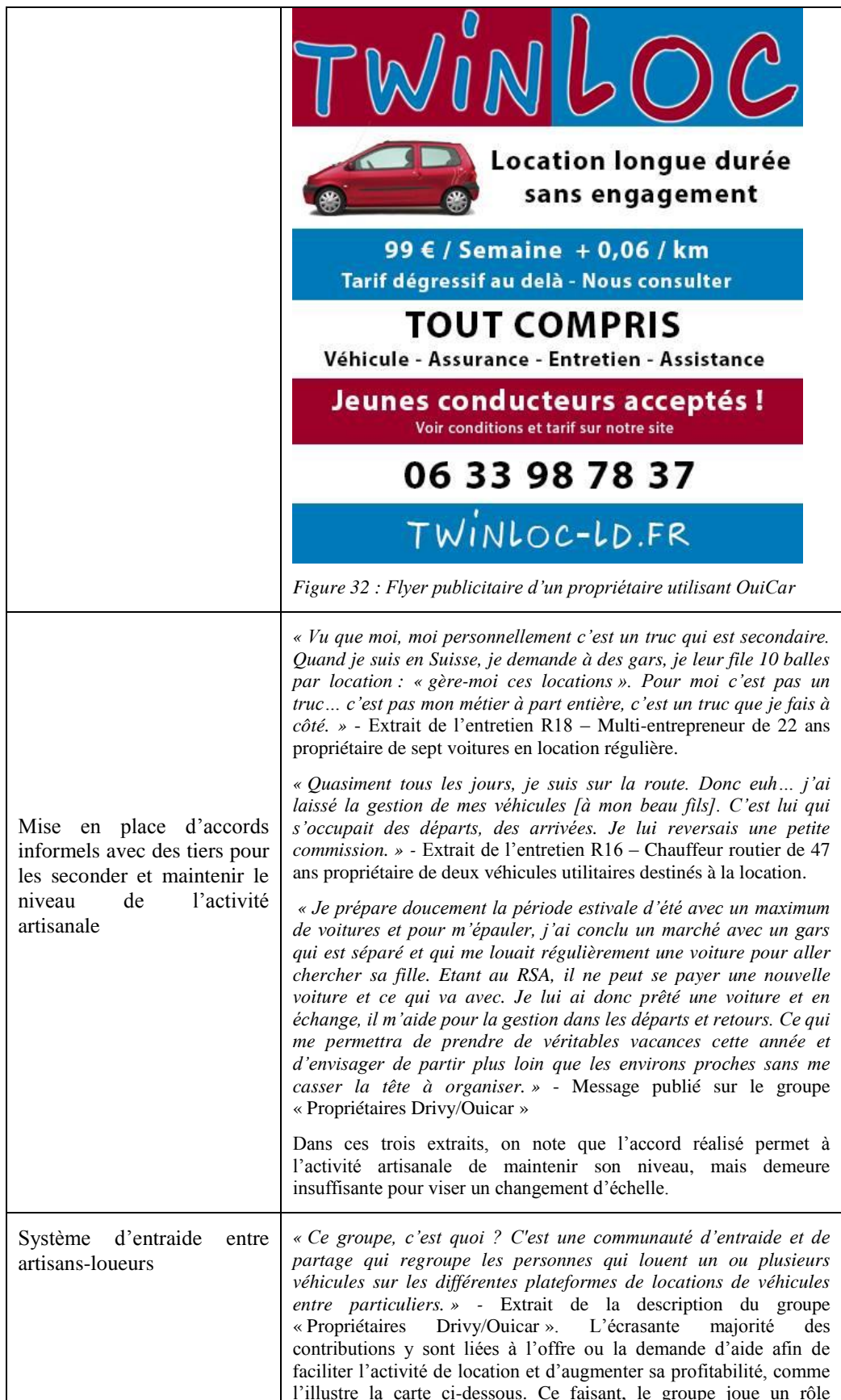
Figure 32 : Flyer publicitaire d'un propriétaire utilisant OuiCar