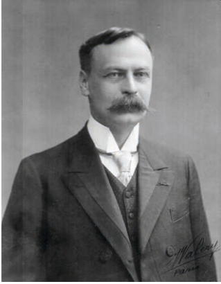
Fig. 1 — Édouard Chavannes (1865-1918).