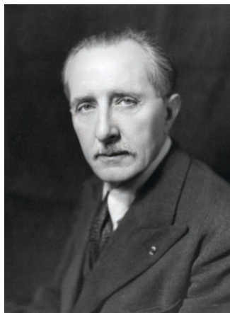
Fig.2 — Paul Pelliot (1878-1945).