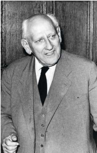
Fig. 4 — Paul Demiéville (1894-1979).

à l'orientation religieuse prise par ses cours au Collège de France depuis 1933-1934. Après avoir associé chaque année un thème à dominante historique à un autre dédié aux idées religieuses, il devait progressivement se tourner résolument vers l'étude du taoïsme, et bientôt vers celle du bouddhisme, à partir de 1936, abordant en parallèle des sujets relatifs aux deux religions. Maspero ne put assurer que brièvement son enseignement à l'EPHE, car il fut déporté à Buchenwald et mourut tragiquement peu de temps après 17 .