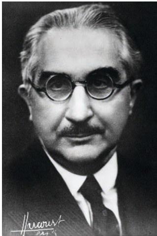
Fig. 3 — Henri Maspero (1883-1945).

et des honneurs qu'il reçut de toutes parts, comme son appartenance comme membre aux Académies anglaise, belge, chinoise, allemande, norvégienne et russe, ses activités à l'EPHE ne sont mentionnées nulle part 12 .