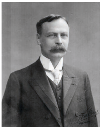
Fig. 1 — Édouard Chavannes (1865-1918).