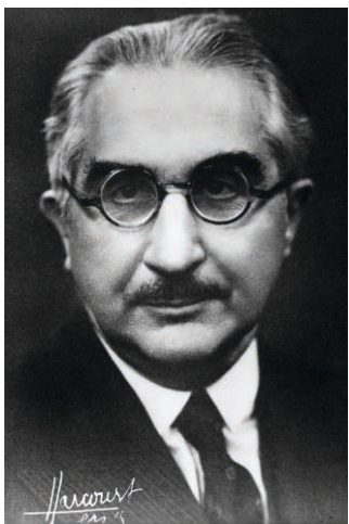
Fig. 3 — Henri Maspero (1883-1945).

et des honneurs qu'il reçut de toutes parts, comme son appartenance comme membre aux Académies anglaise, belge, chinoise, allemande, norvégienne et russe, ses activités à l'EPHE ne sont mentionnées nulle part 12 .