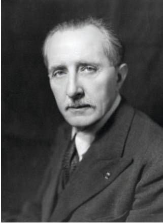
Fig. 2 — Paul Pelliot (1878-1945).