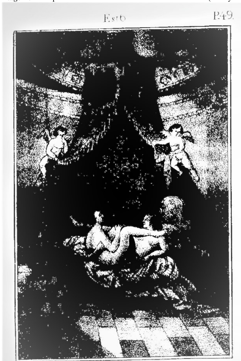
Image 2 : Estampe illustrant Saturnino Porteiro dos Frades Bentos (Anonyme 1842) 6

Fernando Curopos – First name Surname – ” Joanhina ou l’avatar portugais d’Herculine ...”