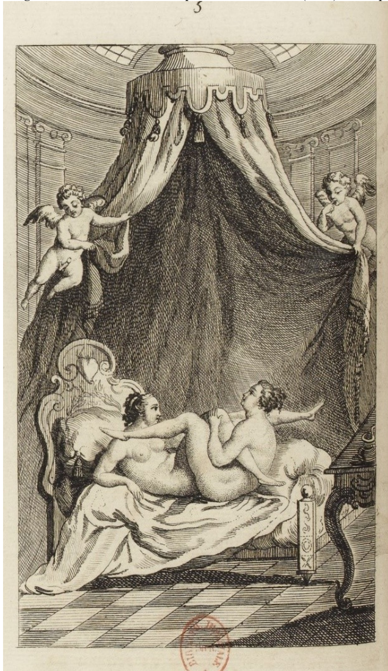
Image 3 : Histoire de D. B***** portier des chartreux (1748). Estampe 3 7