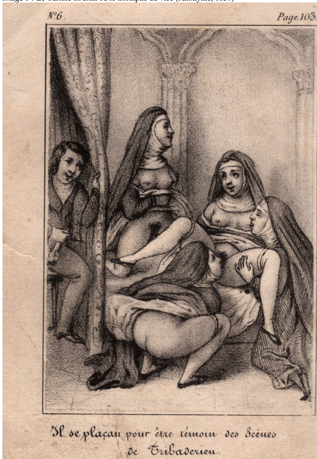
Image 1 : Le Tartufe libertin ou le triomphe du vice (Anonyme, 183?)