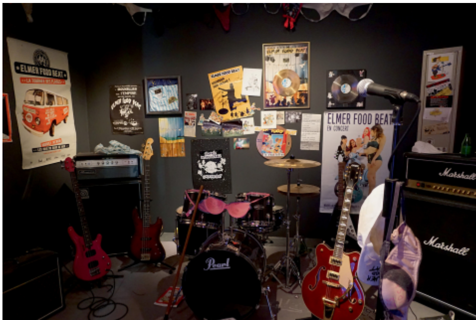
Chateau des ducs de Bretagne - Musée d'histoire de Nantes.