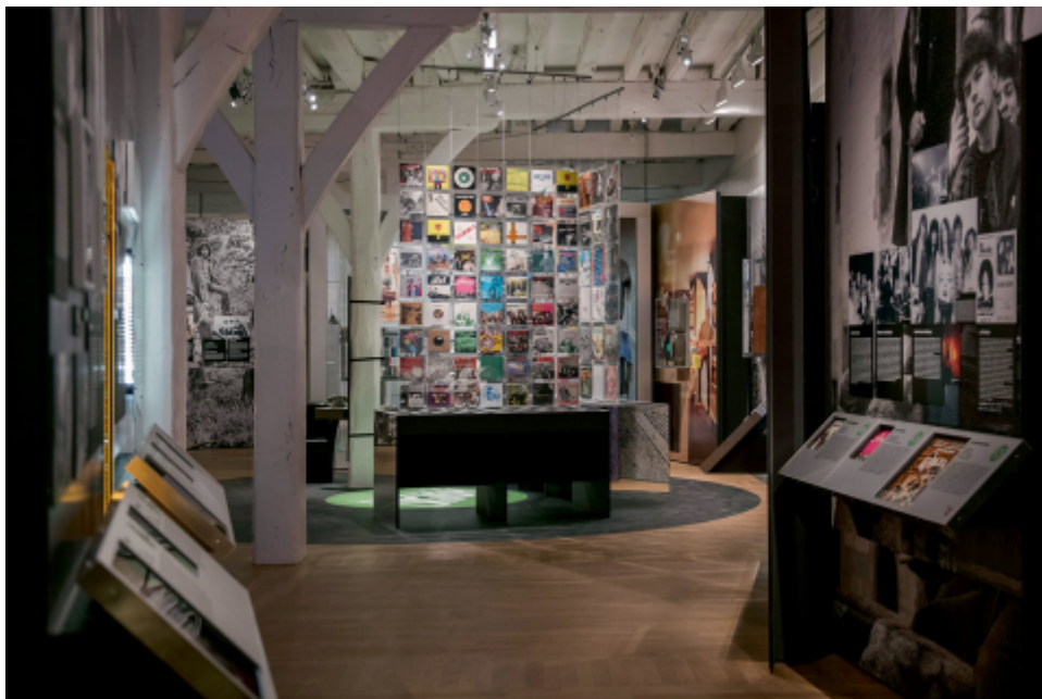
Château des ducs de Bretagne - Musée d'histoire de Nantes.

13 L'immersion voulue dans l'exposition vise donc à contextualiser la production musicale dans des pratiques sociales, qu'elles soient individuelles ou collectives, donnant ainsi la possibilité aux visiteurs de s'y projeter. Cela a d'ailleurs été observé dans nombre d'expositions où « les conservateurs cherchent [...] à créer des expositions narratives qui permettent aux visiteurs de situer leur expérience individuelle dans une mémoire collective 17 », (Baker et al. , 2016a : 8).