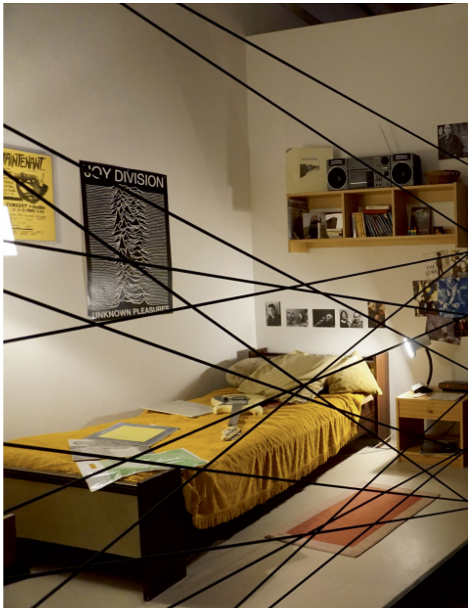
Figure 1. Reconstitution de la chambre de Dominique A.

Chateau des ducs de Bretagne - Musée d'histoire de Nantes.