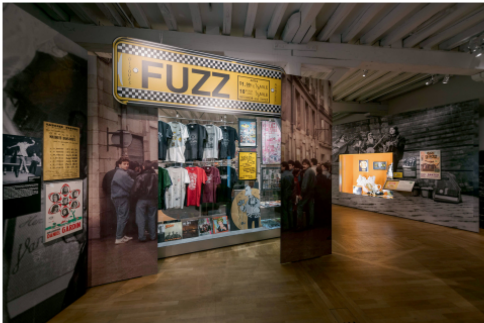
Château des ducs de Bretagne - Musée d'histoire de Nantes.