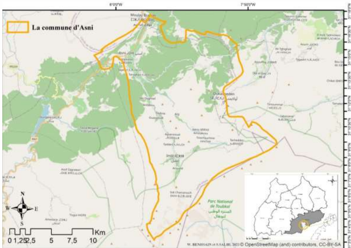
Carte 1 : Localisation de la commune d'Asni

La commune d'Asni se situe dans le haut Atlas occidental à la province d'Al-Haouz dans la région de Marrakech-Safi à environ 64km de Marrakech et à 17 kilomètres de Tahannaout (Carte 1). Elle s'étend sur une superficie de 204 km 2 jusqu'à Imlil et sa population locale est homogène, elle se compose en majorité de la population de la tribu berbère de Rhiraya qui est un grand groupe de Massoud dans le Haut Atlas depuis le XII ème siècle (Pascon, 1977) en plus des populations amazighophones et arabophones provenant des zones géographiques proches de la commune. Ce qui a permis à ce territoire d'avoir des recompositions identitaires, ethniques et aussi religieuses. Ladite population locale a connu également d'autres recompositions dues à l'adaptation à un environnement difficile, dont la dégradation des ressources, la sécheresse, l'érosion etc.