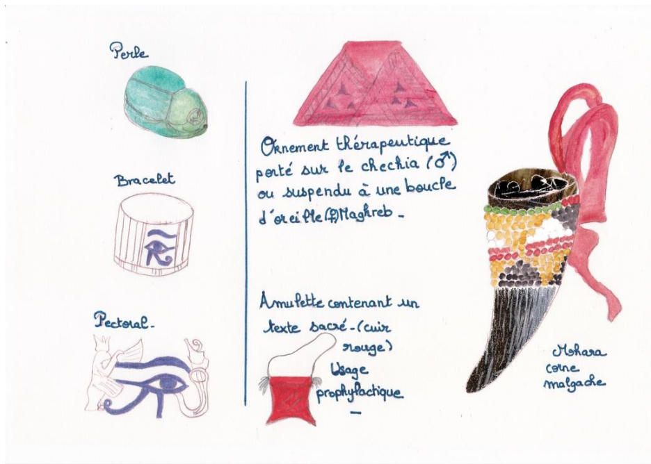
Fig. 2 : Amulettes utilisées en bijoux durant l'Antiquité égyptienne et actuellement.

La minorité copte en Egypte utilise d'autres techniques de parures à visée médicale, comme le tatouage (fig.3) dont la couleur est sombre tirant sur le bleu ou le vert (Perrin 2010 p.47). Là encore, la pratique est proche de celle que l'on peut observer sur les momies antiques, mais la symbolique a changé 3 .