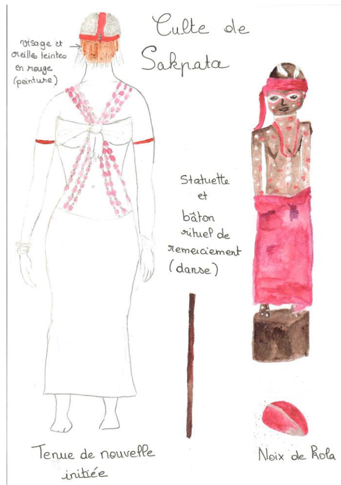
Fig. 4 : le culte de Sakpata. Parure de sortie d'initiation (d'après film de Rouch), statue rituelle, bâton de danse contenant des traces ocrées, et noix de kola.

être vénéré par des fêtes où les adeptes se parent spécifiquement ( fig.4 ). Les peintures corporelles sont réalisées avec des motifs ocellés, afin de rappeler les pustules que Sakpata peut infliger. Leur coloris est bigarré, généralement rouge et blanc. Les mêmes motifs sont visibles pour les objets qui lui sont dédiés, que ce soit des statues anthropomorphes ou des poteries destinées à recueillir les offrandes comme de l'huile rouge, des haricots ou des noix de kola 7 . Les parures varient selon la circonstance de la danse et du niveau d'initiation. La parure la plus simple consiste en un pagne rouge (« couleur de la terre » selon Henry 2010) et un bâton car Sakpata serait infirme d'un pied (Hamberger 2014, p. 448). D'autres ont des atours plus complexes : longs colliers de cauris de couleur magenta ceignant le tronc du corps, coiffe rouge tenant un rideau de perles multicolores masquant le regard, peinture unie rouge du visage voire du corps entier et bracelet de bras en cuir rouge. Le film de Jean Rouch intitulé « sortie des novices » réalisé en 1963 montre ces divers types de parures colorées en rouge 8 .