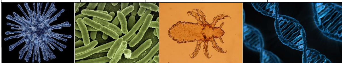
Virus, bactéries, métazoaire, gène muté - images à divers grossissements issues de Pixabay